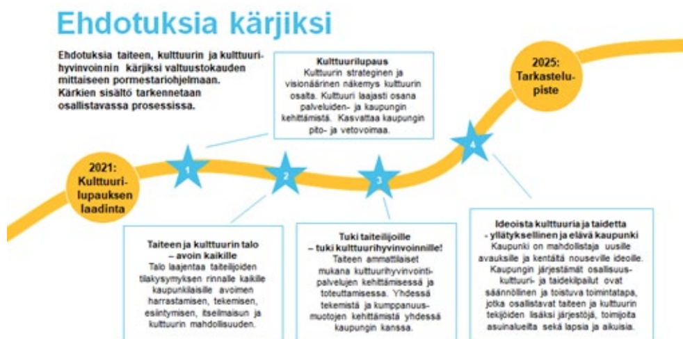
Kuva 7 Ehdotuksia taiteen, kulttuurin ja kulttuurihyvinvoinnin kärjiksi valtuustokauden mittaiseen pormestariohjelmaan.

Turku on vetovoimainen eurooppalainen kulttuurikaupunki, ja tunnetaan myös vahvana liikunta-, tapahtuma- ja matkailukaupunkina. Tätä vetovoimaa vahvistetaan edistämällä kaupunkilaisia aktiivoivia ja matkailijoita houkuttelevia elämyksiä ja tapahtumia. Kaupungin kilpailukykyä vahvistetaan mielenkiintoisilla sisällöillä, elämyksillä ja kaupunkikulttuurilla, jotka ovat keskeisiä vetovoimatekijöitä ja luovat elävän kaupungin.