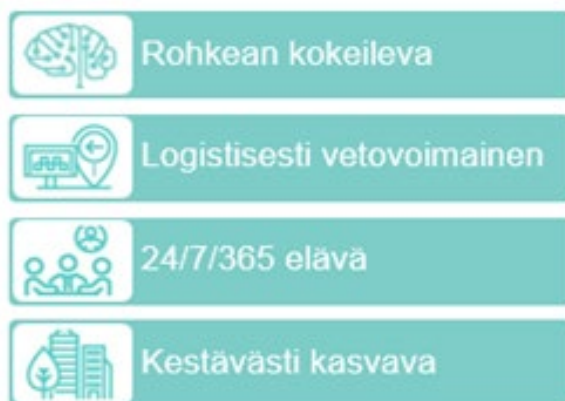
Kuva 6 Tiedepuisto -kärkihankkeen painopistealueet.

Tiedepuisto -kärkihanke rakentuu kuvan 6 mukaisista painopistealueista. Tiedepuiston kehittämisen painopistealueet toimivat kärkihankkeen toteuttamisohjelman pohjana. Toimenpideohjelman kytkeyty mittaristo jolla toteutumista seurataan.