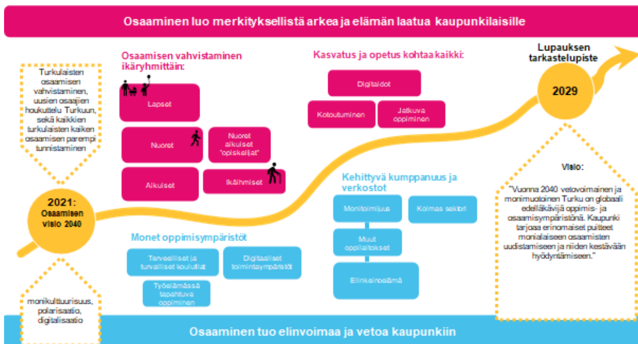
Kuva 8 Osaaminen osana kaupunkia ja osaamisen visio 2040

Yhteisöllisyyden, hyvinvoinnin ja asuinalueiden tasapainoisen kehityksen kärkihanke