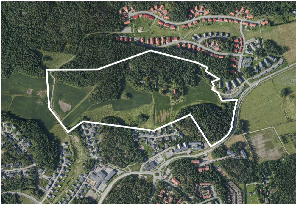
Ilmakuva © Turun kaupunki