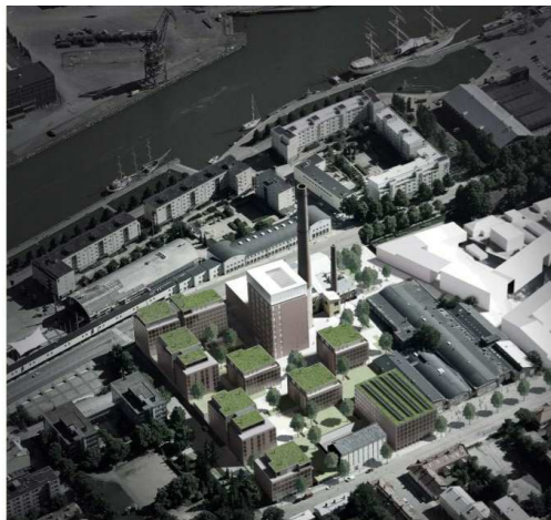
Havainnekuva tontinkäyttösuunnitelmasta "Rasteri" / Sigge Arkkitehdit Oy

Poistuvan kaavan tunnus ja voimaantulopäivä.