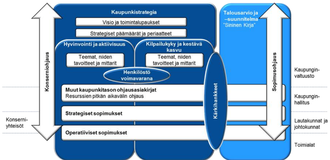
Kuva 1: Turun kaupungin strategiahierarkia.

Kaupunkistrategia sisältää kaupungin pitkän tähtäimen vision ja toimintalupaukset sekä kaupunkitason yhteiset päämäärät. Strategisissa ohjelmissa tehdään toimintaa ohjaavat linjaukset, jotka tarkentuvat toimialojen strategisissa ja operatiivisissa sopimuksissa käytännön toimenpiteiksi.