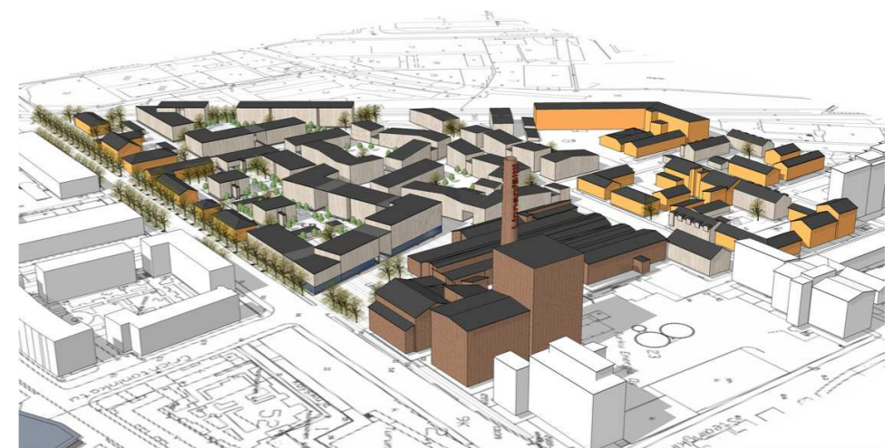
HAVAINNEKUVAT Schauman Arkkitehdit Oy