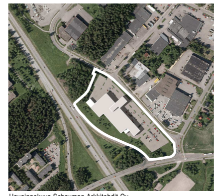
Havainnekuva Schauman Arkkitehdit Oy

POISTUVA KAAVA Merkintöjen selite: 3 m kaava-alueen rajan ulkopuolella oleva viiva, jota otsakkeessa mainittu kaavanmuutos koskee ja jolla aiemmat kaavamerkinnot ja -määräykset poistuvat. A43/2007 Aiemman, poistuvan kaavan numero ja vahvistuspäivämäärä. 16.12.2008