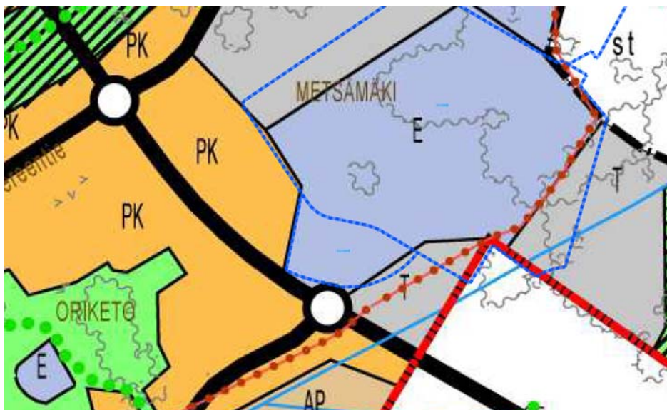
Ote oikeusvaikutteisesta yleiskaavasta 2020

Oikeusvaikutteinen Turun yleiskaava 2020 on hyväksytty kaupunginvaltuustossa 18.6.2001.