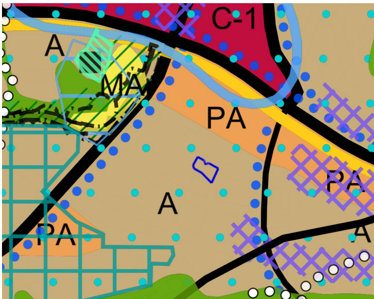
Kuva 2. Ote yleiskaavasta 2029.

Turun yleiskaava 2029 on tullut voimaan 10.8.2024. Yleiskaavassa suunnittelualue on osa valmista asuinalueita A, jossa voi toteuttaa sen ominaispiirteet huomioivia muutoksia. Suunnittelualue on yleiskaava 2029:n alueinventoinnissa osa muuta kaavalla muodostettua aluekokonaisuutta Ruohonpää – Lukoilantie – Vakka-Suomentie, jossa on eri ikäisiä ja tyyllisiä omakotitaloja ja 60–70-luvun rivitaloalue.