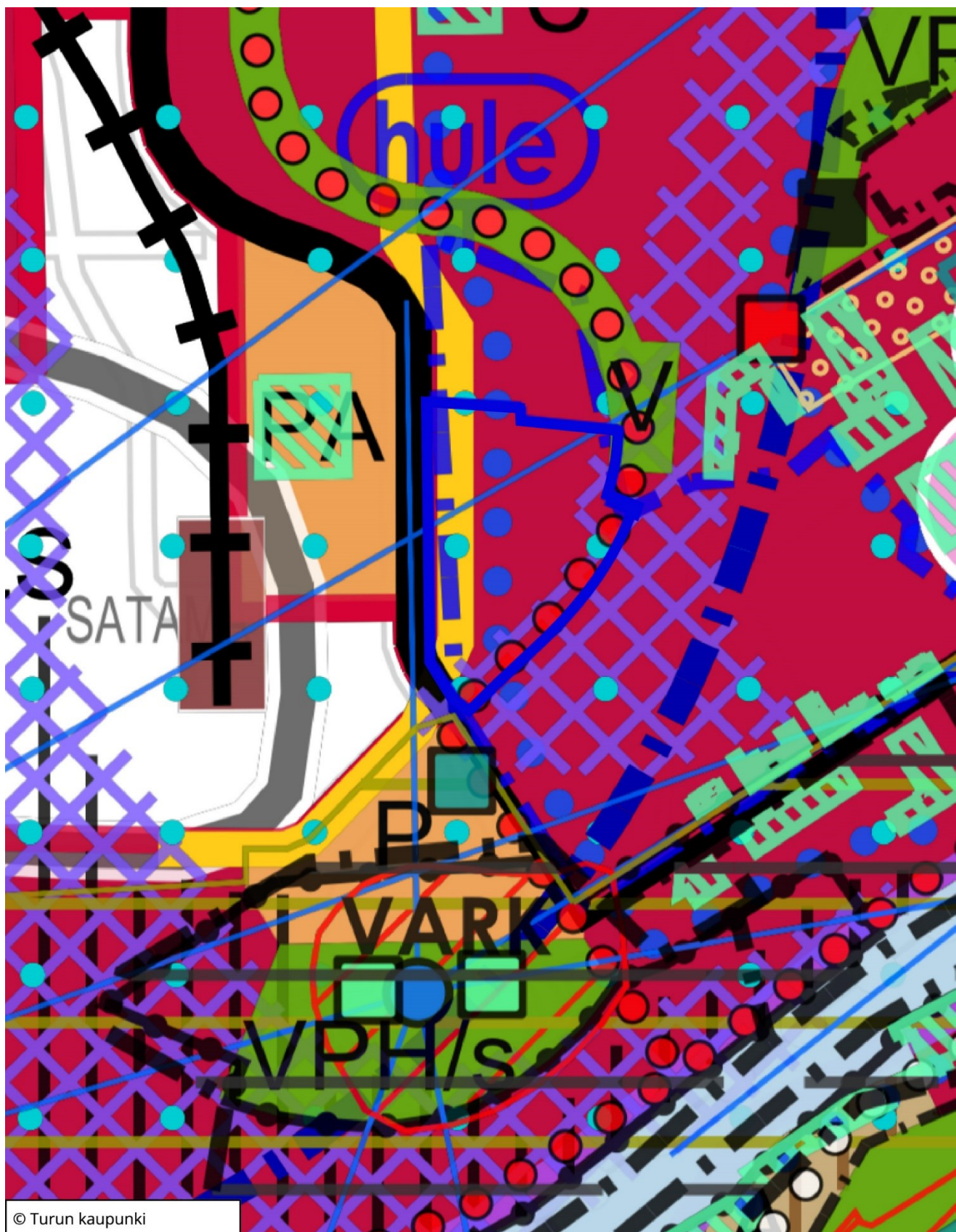
Kuva 2. Ote Yleiskaava 2029:sta.