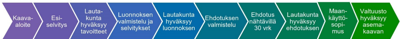
XL-kokoisen kaavan prosessi

Osallisia kaavan valmistelussa ovat alueen maanomistajat ja ne, joiden asumiseen, työntekoon ja muihin oloihin kaava saattaa huomattavasti vaikuttaa, sekä viranomaiset ja yhteisöt, joiden toimialaa suunnittelussa käsitellään. Tämän hankkeen osalta osallisiksi on arvioitu seuraavat tahot: