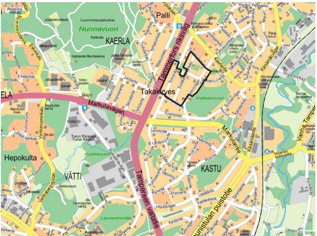
Kuva 1. Kaava-alueen sijainti.