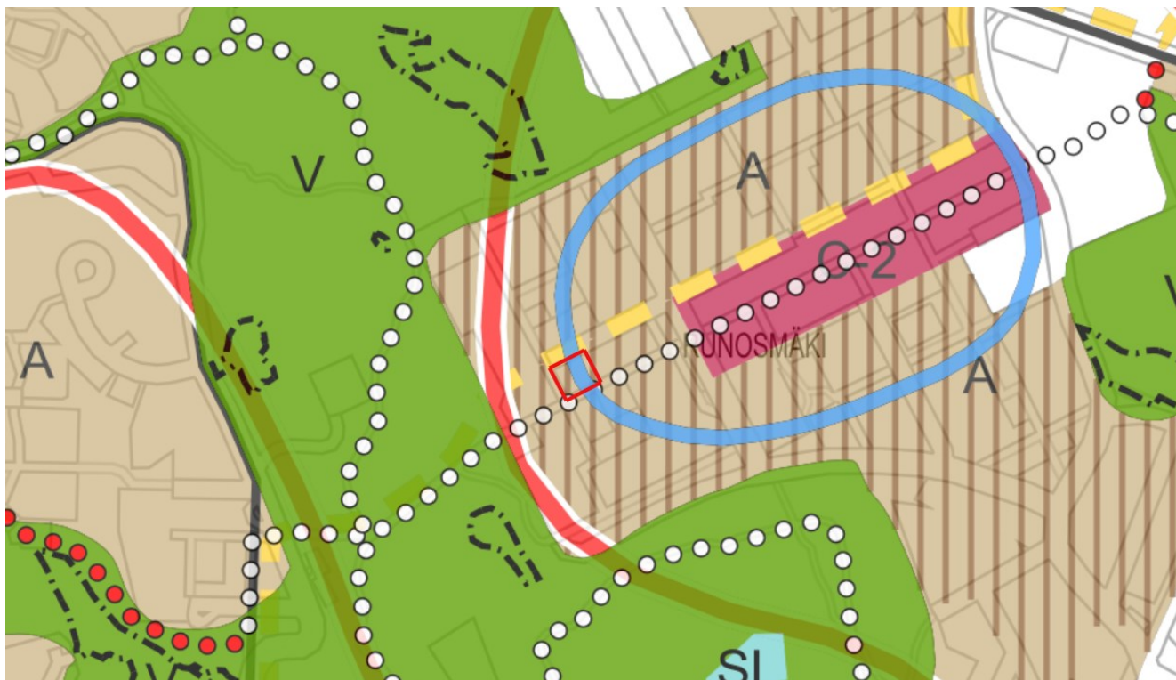
Kuva 2. Ote yleiskaavasta. © Turun kaupunki

Suunnittelualueen asemakaava (36/1986) on tullut voimaan 20.5.1988. Asemakaavassa alue on määritelty julkisten lähipalvelurakennusten korttelialueeksi (YL-1), jonka autopaikat on osoitettava Munte-rinkadun toisella puolella sijaitsevalta LPA-1 alueelta.