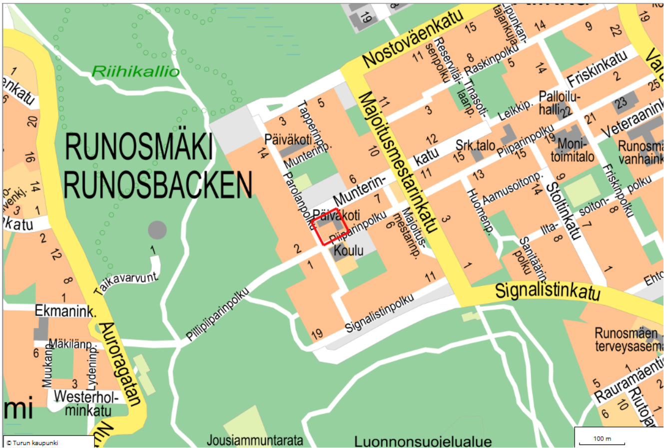
Kuva 1. Kaava-alueen sijainti.

Kaupunginosa: Runosmäki Osoite: Munterinkatu 3a