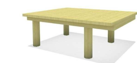
5. esteetön hiekkaleikkipöytä