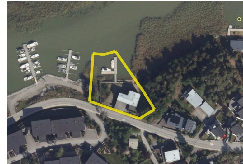
ILMAKUVA © Turun kaupunki

Till denna detaljplanekarta hör en beskrivning där uppgifter om planens utgångspunkter och mål, motiveringar till planlösningen samt en redogörelse av detaljplanen och dess verkningar ingår.