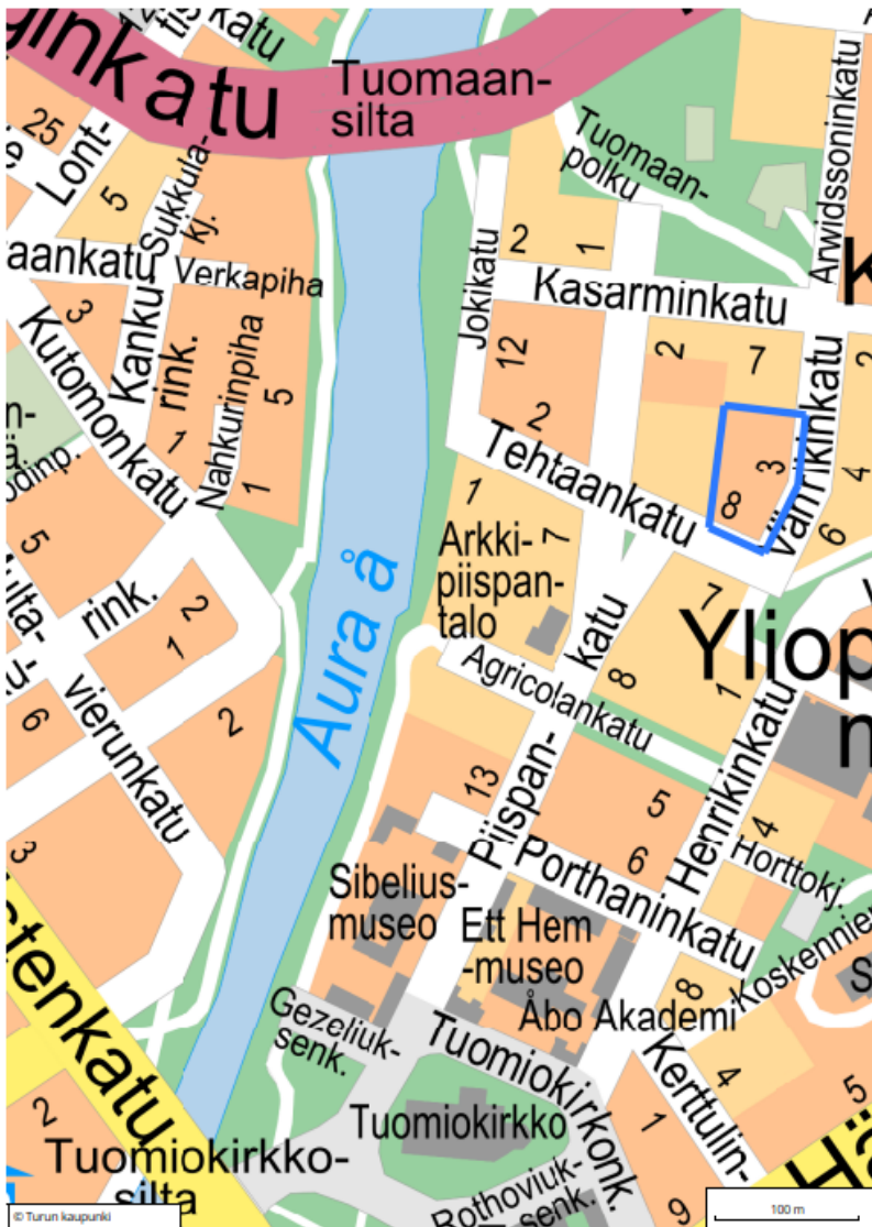
Kuva 1. Kaava-alue on rajattu sinisellä Tehtaankadun ja Vänrikinkadun kulmaan.