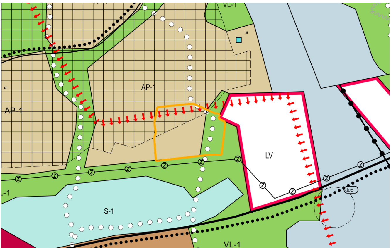
Kuva 3. Karttaote Hirvensalon osayleiskaavasta.

Osayleiskaavassa alueen läpi kulkee ulkoilureitti. Kaavanmuutosalueen välittömässä läheisyydessä on myös suurjännitelinja, venevalkama-alue (LV) ja luonnonsuojelulain 29 §:n perusteella suojeltu luontotyyppi (S-1).