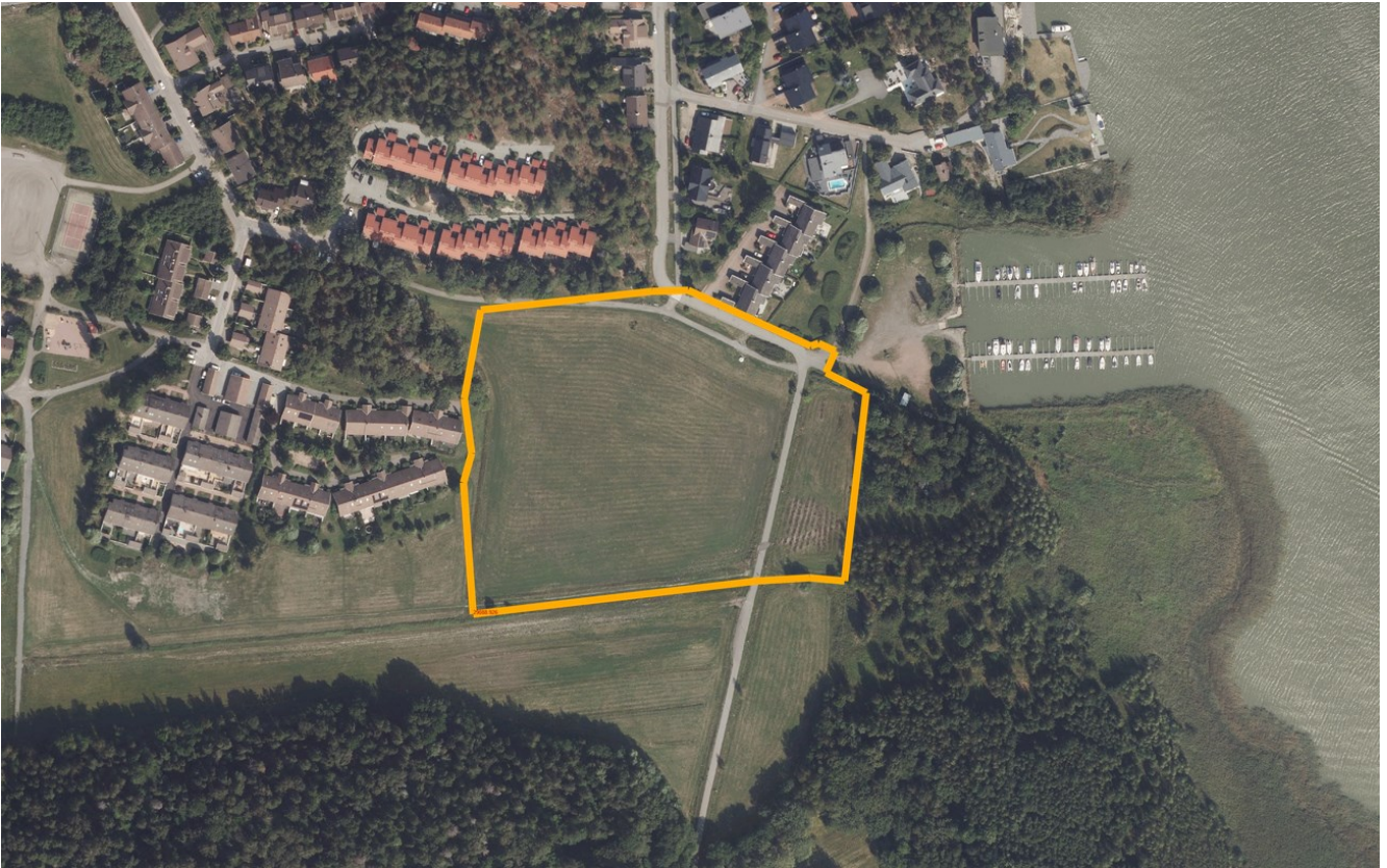
Kuva 2. Ilmakuva kaavanmuutosalueesta (2023).