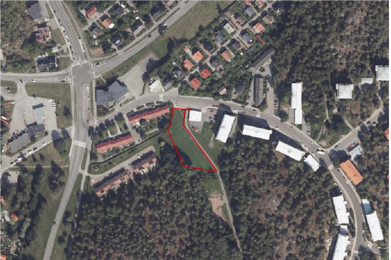
Kuva 2. Ilmakuva suunnittelualan nykytilanteesta (2023).