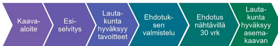
M-kokoisen kaavan prosessi

Osallisia kaavan valmistelussa ovat alueen maanomistajat ja ne, joiden asumiseen, työntekoon ja muihin oloihin kaava saattaa huomattavasti vaikuttaa, sekä viranomaiset ja yhteisöt, joiden toimialaa suunnittelussa käsitellään. Tämän hankkeen osalta osallisiksi on arvioitu seuraavat tahot: