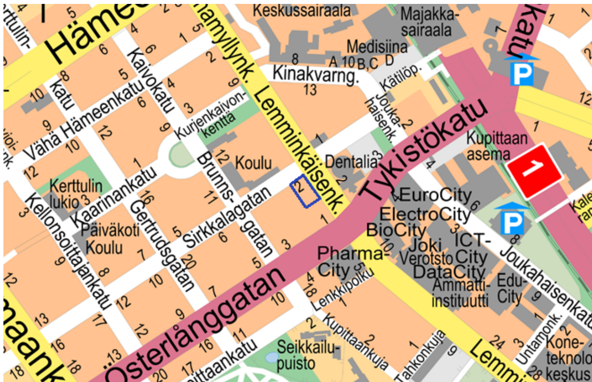
Kuva 1. Kaava-alueen sijainti merkittynä sinisellä Lemminkäisenkadun varteen.