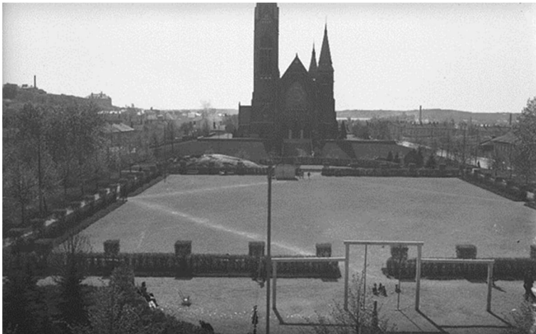
Valokuva uudesta puistosta. Etualalla leikkipaikka. Leikatut pensasaidat rajaavat kenttää. Taustalla Mikaelinkirkko. 1.7.1942