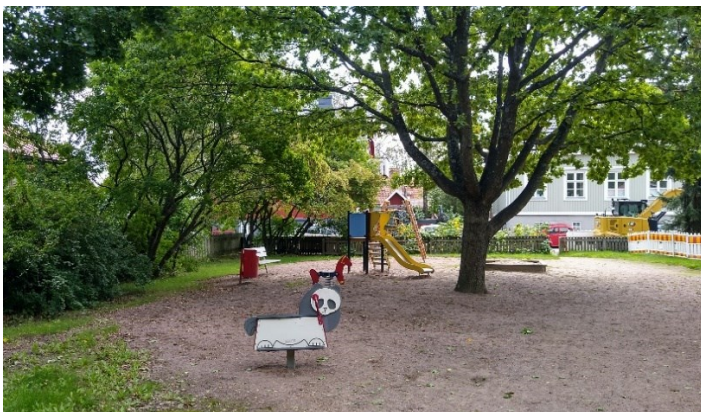
Puiston keskellä on kookas tammi.

Suunnitelman luonnos oli asukkailla kommentoitavana v. 2021. Tuolloin saatiin kaksi palautetta, jotka koskivat varusteita.