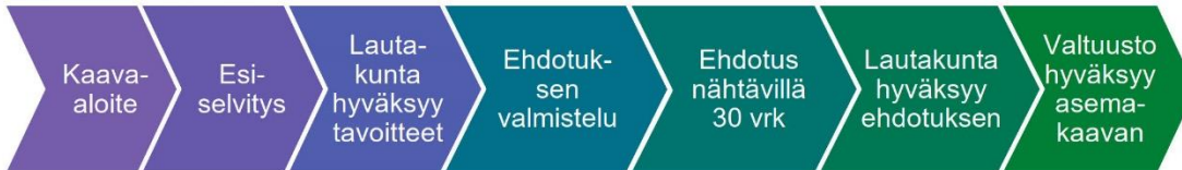
L-kokoisen kaavan prosessi

Osallisia kaavan valmistelussa ovat alueen maanomistajat ja ne, joiden asumiseen, työntekoon ja muihin oloihin kaava saattaa huomattavasti vaikuttaa, sekä viranomaiset ja yhteisöt, joiden toimialaa suunnittelussa käsitellään. Tämän hankkeen osalta osallisiksi on arvioitu seuraavat tahot: