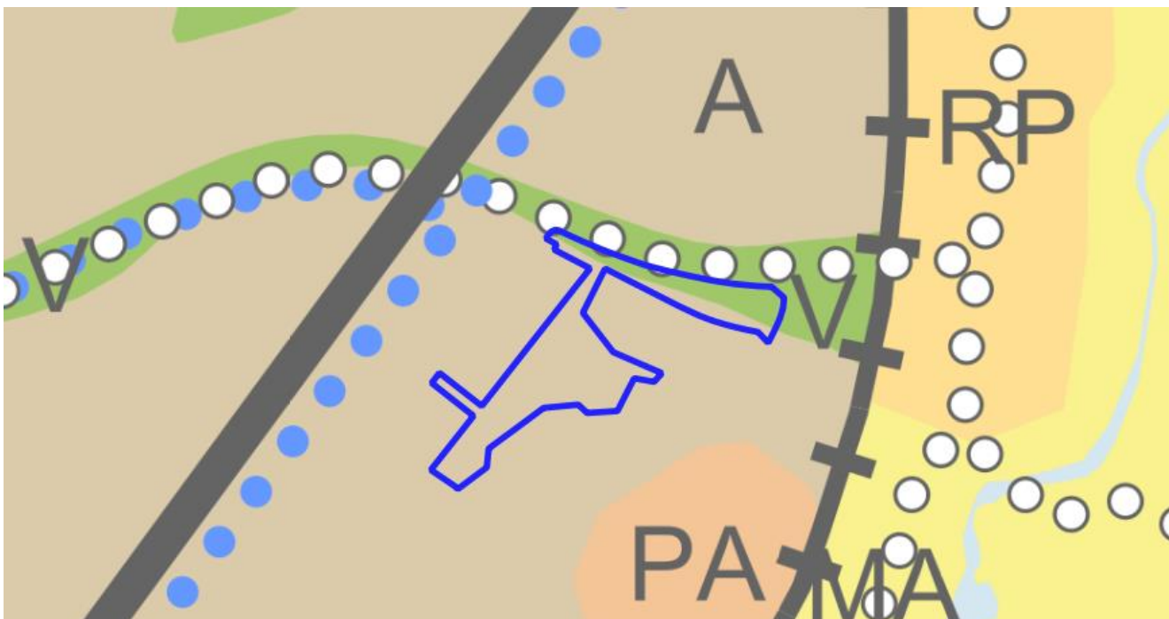
Kuva 2. Ote Yleiskaavan 2029 Yhdyskuntarakenne -kartasta.

Asemakaavassa alueen pohjoisosassa on Viruspiennar-niminen suojaviheralue (EV). Alueen eteläosa, Virusmäenpuisto on lähivirkistysaluetta (VL). Lähivirkistysalueen eteläiseen reunaan on osoitettu kulkuyhteys Lestipolku, joka haarautuu vielä Pinniahde-nimiseksi poluksi. Kulkuväylät on nykyisellään toteutettu osana puistoa.