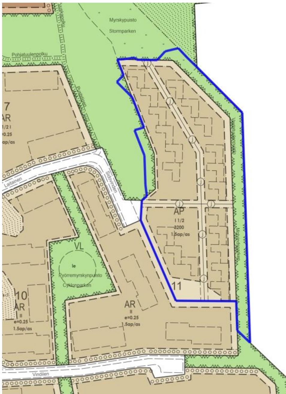
Kuva 3. Ote ajantasa-asemakaavasta. Suunnittelualue sinisellä rajauksella.

Alueella on voimassa asemakaava (tullut voimaan 9.4.1994), jossa suurin osa alueesta kuuluu asuinpientalojen korttelialueeseen (AP) eli alueelle saa rakentaa enintään kaksiasuntoisia erillis- tai kytkettyjä pientaloja. Muut osat suunnittelualueesta ovat asemakaavassa puistoaluetta (VP).