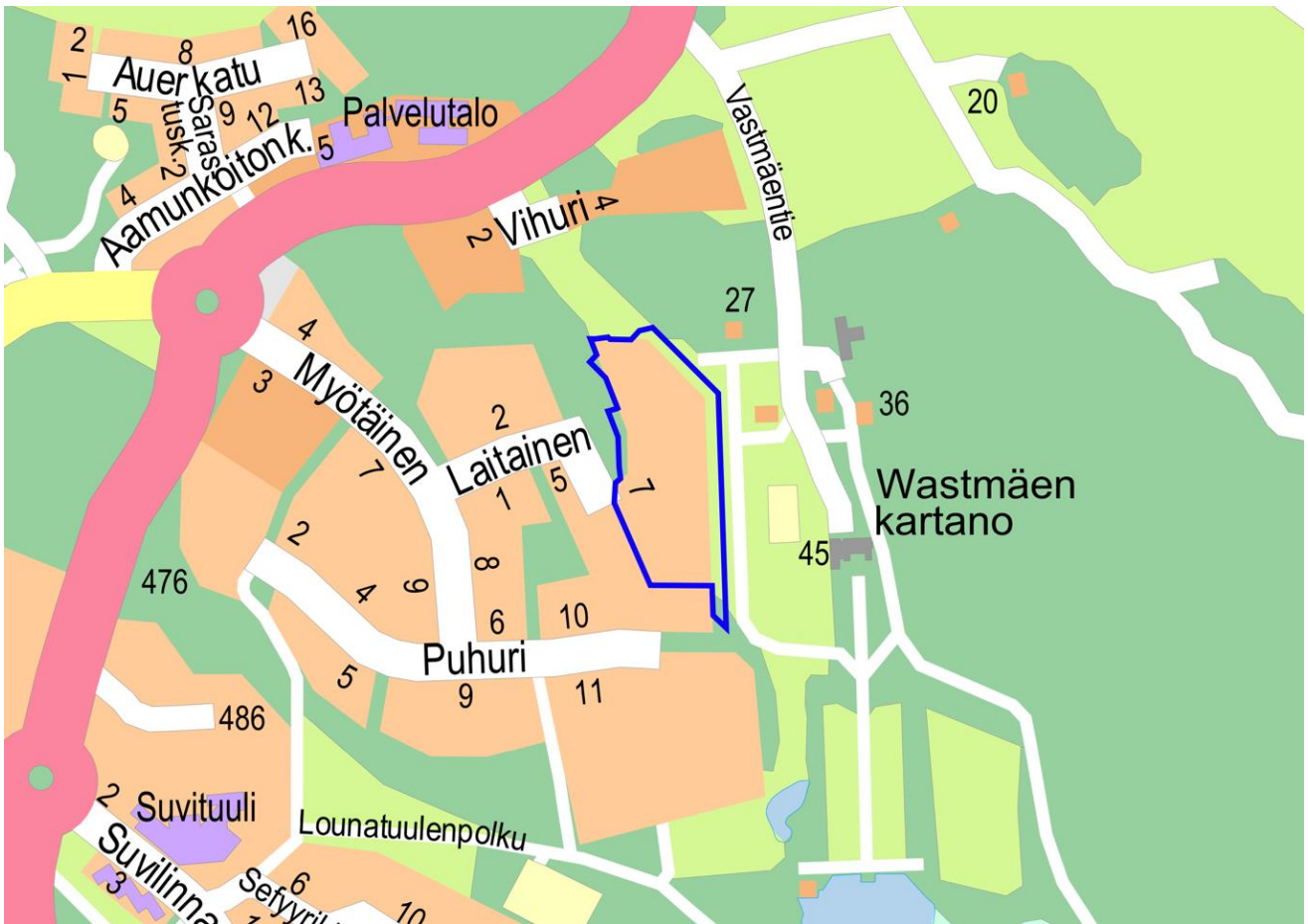
Kuva 1. Kaava-alueen sijainti opaskartalla. Suunnittelualue sinisellä rajauksella.