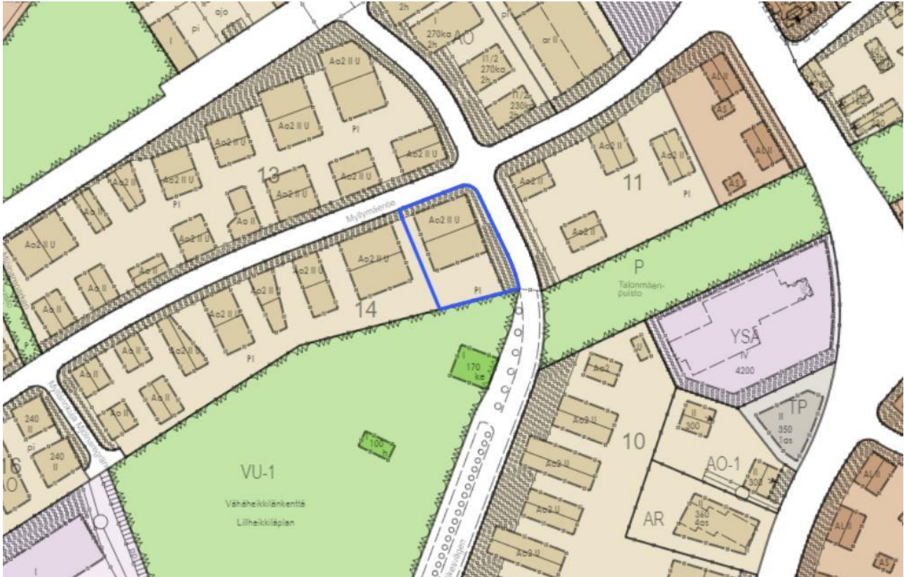
Kuva 5. Ote ajantasa-asetmakaavasta. Suunnittelualue on merkitty sinisellä rajauksella.

Asemakaavassa , joka on tullut voimaan 29.7.1959, kohde on merkitty tunnuksella Ao2 II U, joka merkitsee rakennusala-asuinrakennusta ja talousrakennusta varten. Kaava mahdollistaa pohjapinta-alaltaan 70–130 m 2 suuruisen asuinrakennuksen, jonka lisäksi ullakosta 3/5 saa sisustaa asuintiloiksi ja enintään 50 m 2 talousrakennuksen rakentamisen. Asuinrakennuksessa saa olla enintään kaksi asuntoa. Asuinrakennuksen kerrosluku on enintään kaksi. Olemassa oleva vanha asuinrakennus ei sijoitu kaavassa määritellylle rakennusalueelle.