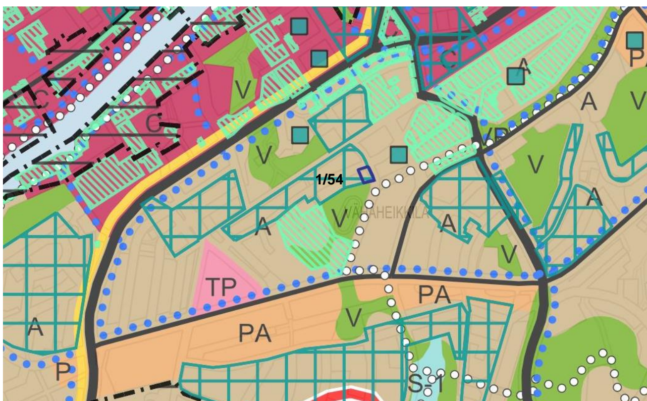
Kuva 4. Ote Yleiskaava 2029 ehdotuksesta 13.2.2023. Kartat 1, 7 ja 8. Kohde on merkitty kaavaotteeseen sinisellä rajauksella. Kuvassa näkyy ruudutettuina ja raidoitettuina alueina arvokkaat rakennusympäristön kokonaisuudet ja neliömerkinnöillä arvokkaat rakennusympäristön kohteet. Valkoisella pisteetyksellä on merkitty ulkoilureitti, sinisellä pyöräilyn pääverkosto.