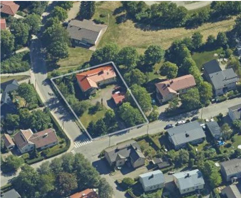
Kuva 2. Viistoilmakuvaan on merkitty suunnittelualueen rajaus.

Kaavanmuutoksen yhteydessä tutkitaan olemassa olevan rakennuksen suojelutarve. Uudisrakennuksen kerrosluvun ja rakennusoikeuden määrittämisessä otetaan huomioon sopeutuminen lähiympäristöön ja sen ominaispiirteisiin.