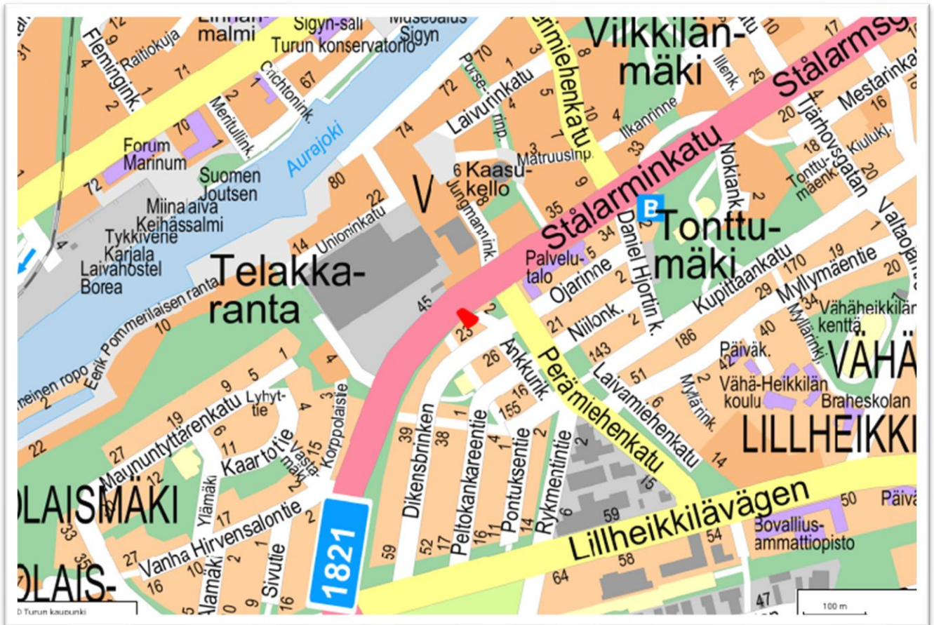
Kuva 1. Kaava-alueen sijainti. (1:10000)