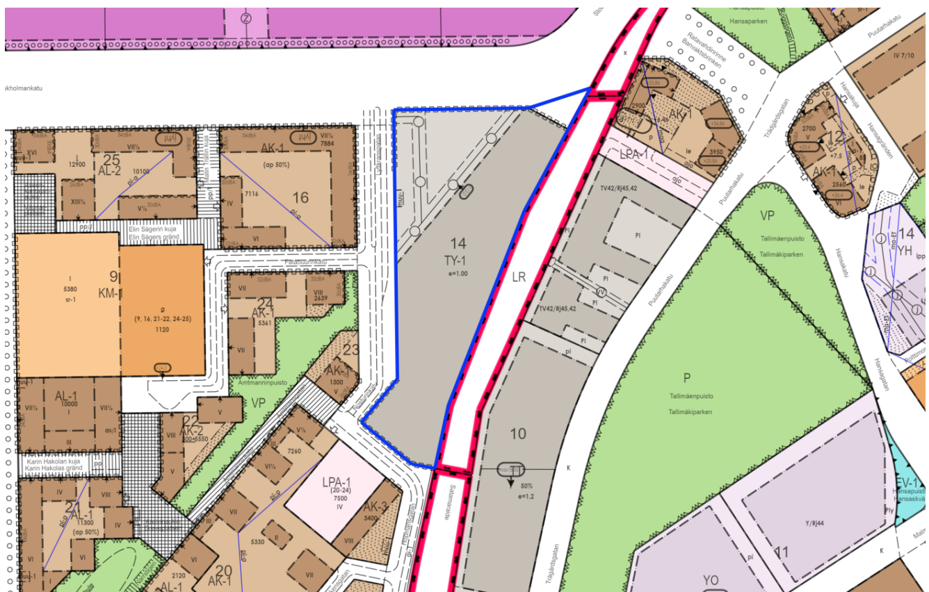
Kuva 3. Ote ajantasa-asemakaavasta.

Alueen asemakaava Herttuankulma 27/2013 on tullut voimaan 7.7.2018. Siinä korttelille 14 osoitetaan ympäristöhäiriöitä aiheuttamattomien teollisuusrakennusten korttelialue TY-1. Rakennusten suurin sallittu kerrosluku on kaksi ja julkisivupinnan ja vesikaton leikkauskohdan ylin korkeusasema +13.0. Asemakaavaan on merkitty sijainniltaan ohjeellinen muuntamo varten varattava tila maantasossa. Korttelialueelle ei saa järjestää liittymää sen etelä- eikä pohjoispäädystä. Korttelin luoteiskulmassa on johtoa varten varatut alueen osat. Tontin tehokkuusluku e = 1.0 .