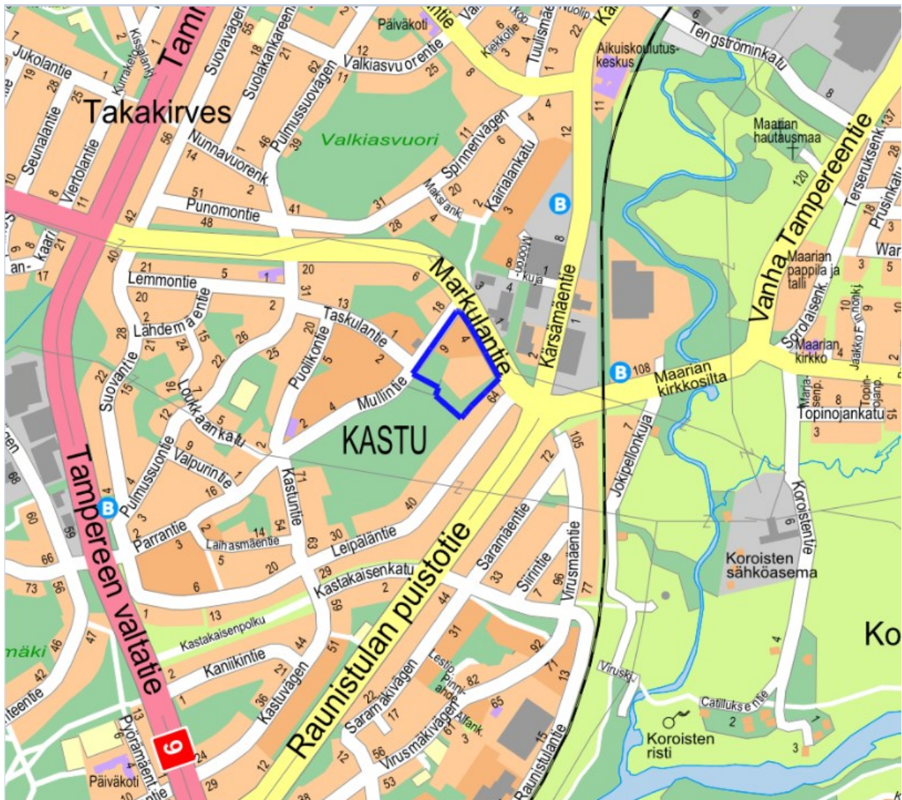
Kuva 1. Kaava-alueen sijainti.