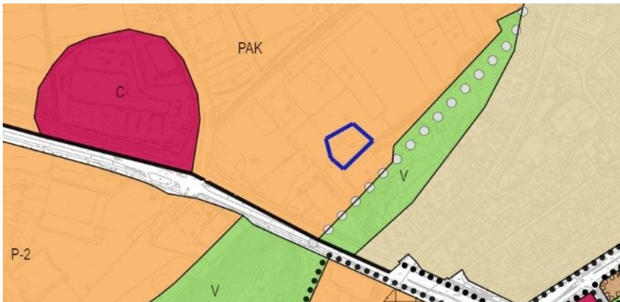
Kuva 2. Ote Turun yleiskaava 2020:sta, jossa suunnittelualue on rajattu sinisellä viivalla.

Yleiskaava 2020: ssa suunnittelualue sisältyy työpaikkojen ja asumisen alueeseen (PAK).