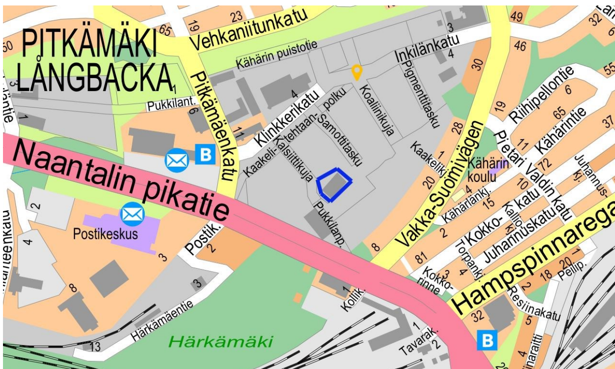
Kuva 1. Kaava-alueen sijainti, johon suunnittelualue on rajattu sinisellä.

Kaupunginosa: (074) Pitkämäki Osoite: Kalsiittikuja 12