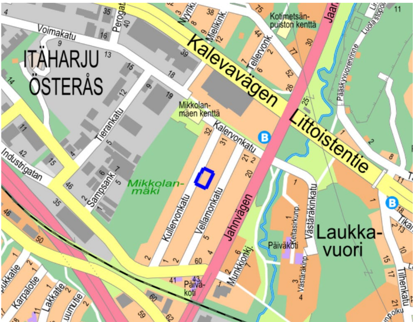
Kuva 1. Kaava-alueen sijainti.

Kaupunginosa: Itäharju Osoite: Kullervonkatu 23