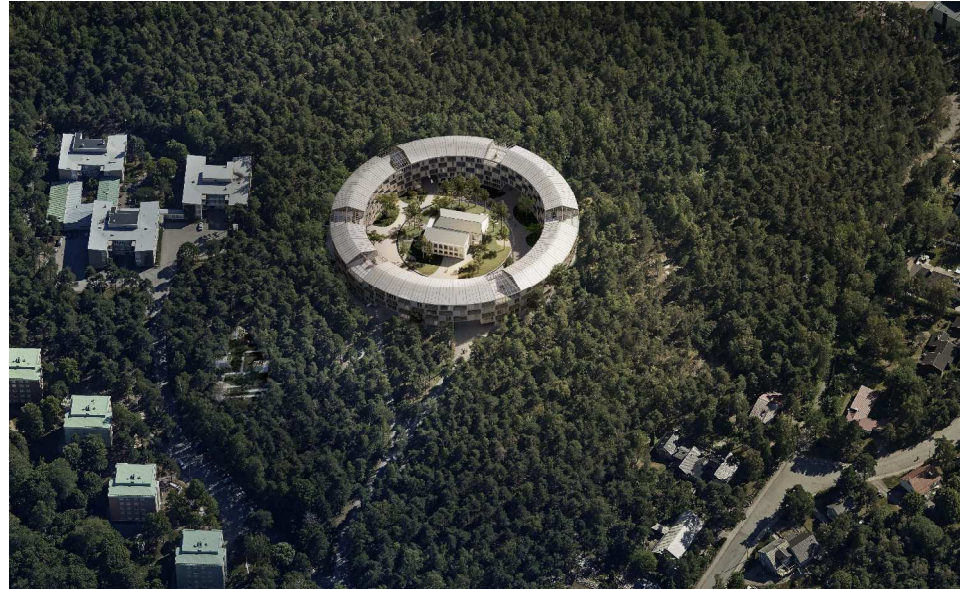
HAVAINNEKUVA Viitesuunnitelma 30.3.2021