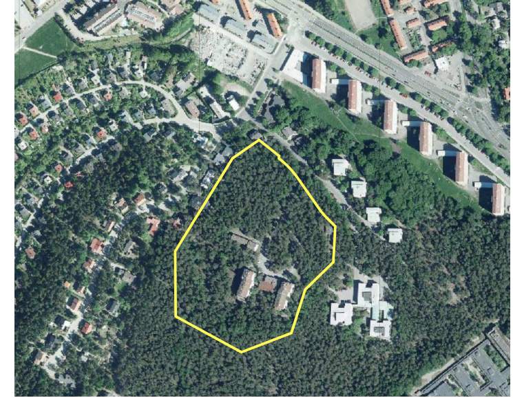
HAVAINNEKUVA Viitesuunnitelma 30.3.2021 / Schauman & Nordgren Architects