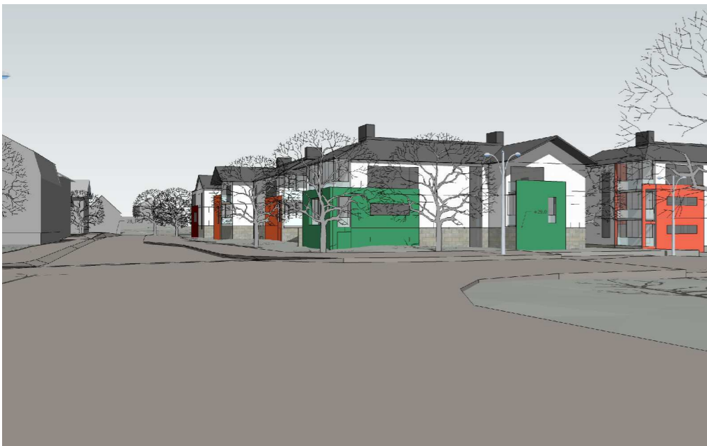
Näkymä Vanhalta Hämeentieltä, Arkkitehtitoimisto C & CO Oy, 30.10.2017