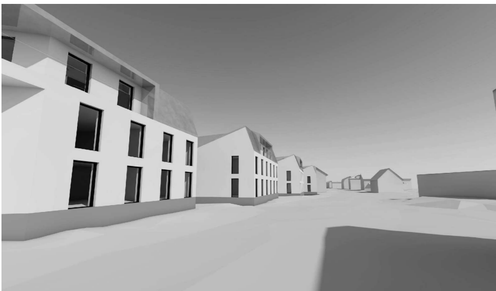
Näkymä Vanhalta Hämeentieltä, 30.10.2017