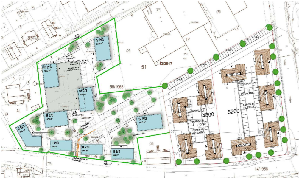
Rakentamistapaluonnos, Schauman Arkkitehdit Oy ja Arkkitehtitoimisto C & CO Oy, 30.10.2017