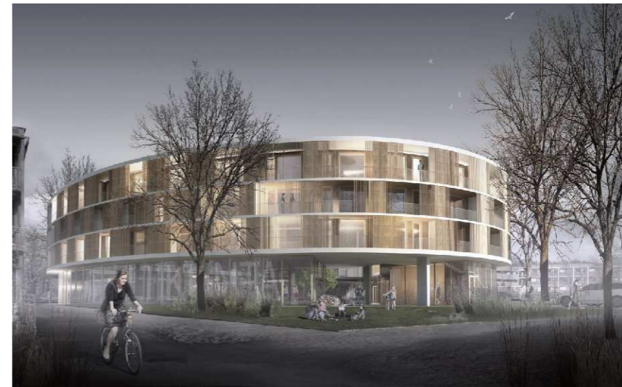
HAVAINNEKUVA SIGGE ARKKITEHDIT OY