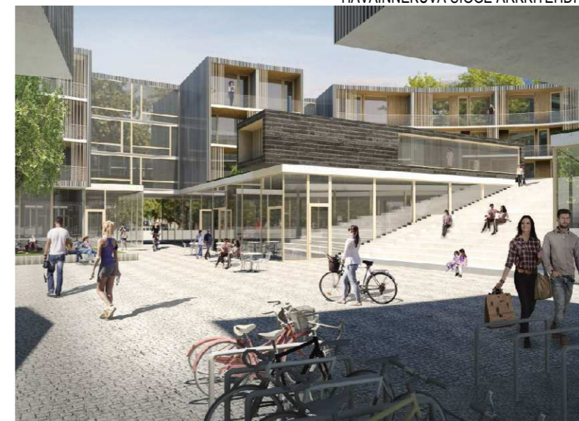
HAVAINNEKUVA SIGGE ARKKITEHDIT OY