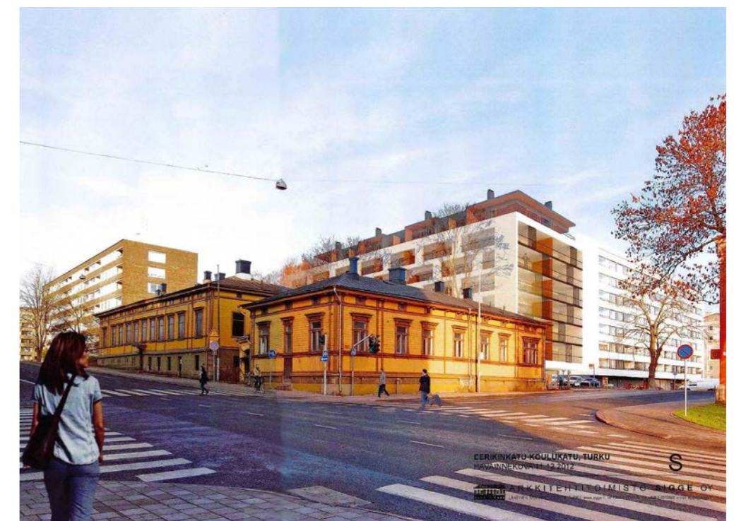
Havainnekuva, asemakaavaehdotuksen mahdollistama toteutustapa © Arkkitehtitoimisto Sigge Oy