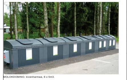
MOLOKDOMINO, kivenharmaa, 6 x 5m3.