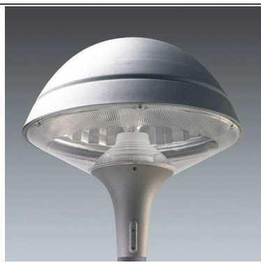
PUUSTOVALAISIN ESIM. ALPILUX PLURIO