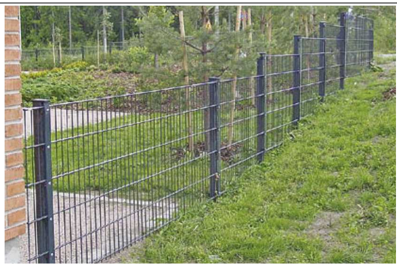
METALLIVERKKOITA ESIM. VEPE SRT