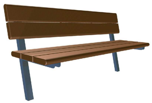
PENKKI ESIM. PUUHA 00173