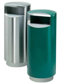
ROSKAKORI ESIM. L&T CITY 100L