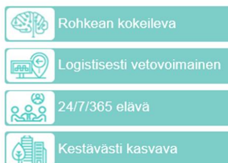
Kuva 2. Tiedepuisto -kärkihankkeen painopistealueet

Tiedepuisto -kärkihanke rakentuu kuvan 1 mukaisista painopistealueista. Tiedepuiston kehittämisen painopistealueet toimivat kärkihankkeen toteuttamisohjelman pohjana.