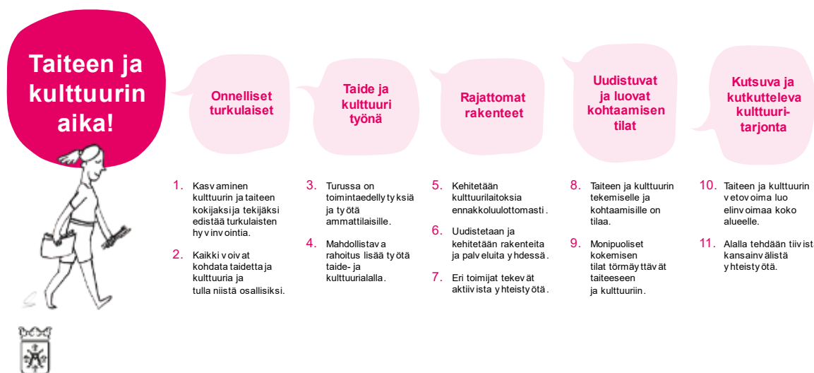
Kuva 3. Kulttuurilupaus, kärkiteemat ja tavoitteet

Kulttuurin kärkihanke on jaettu kolmeen projektiin: Kulttuurista hyvinvointia, Kulttuurista työtä ja Kulttuurista elinvoimaa.