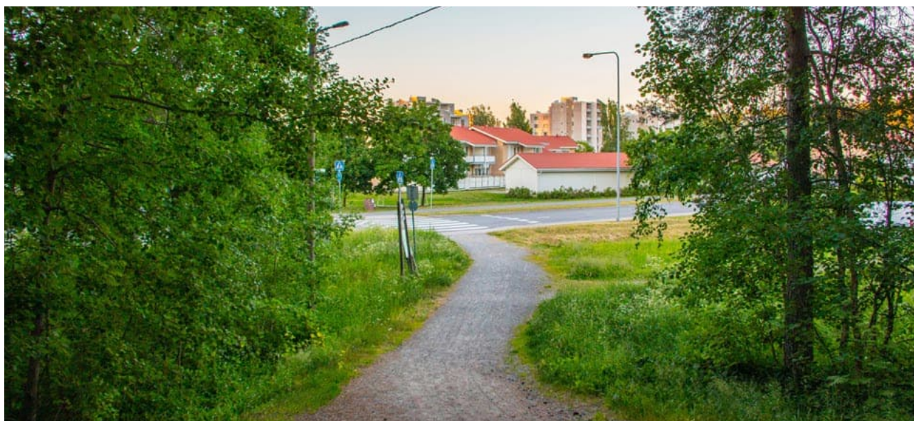
Taulukko 1. Kaupunkitutkimusohjelman mukaisen tutkimusyhteistyön rahoitus.