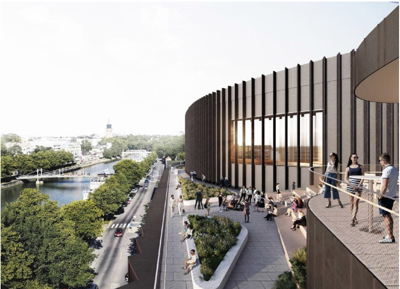
Konserttitalon havainnekuva. KUVA: PES-ARKKITEHDIT