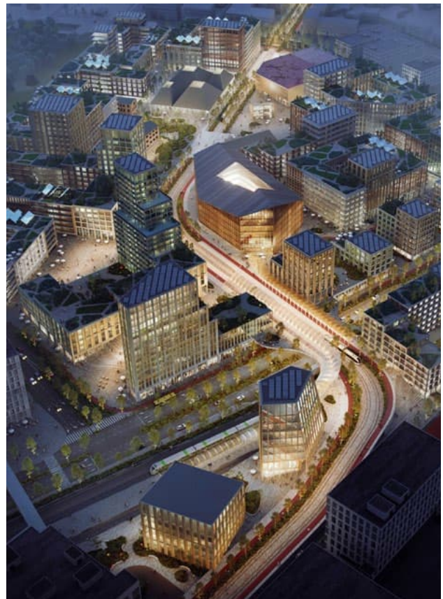
Kupittaaan kärjen havainnekuva. KUVA: LUNDEN ARKKITEHDIT OY & ARKKITEHDIT VON BOEHM-RENNELL OY