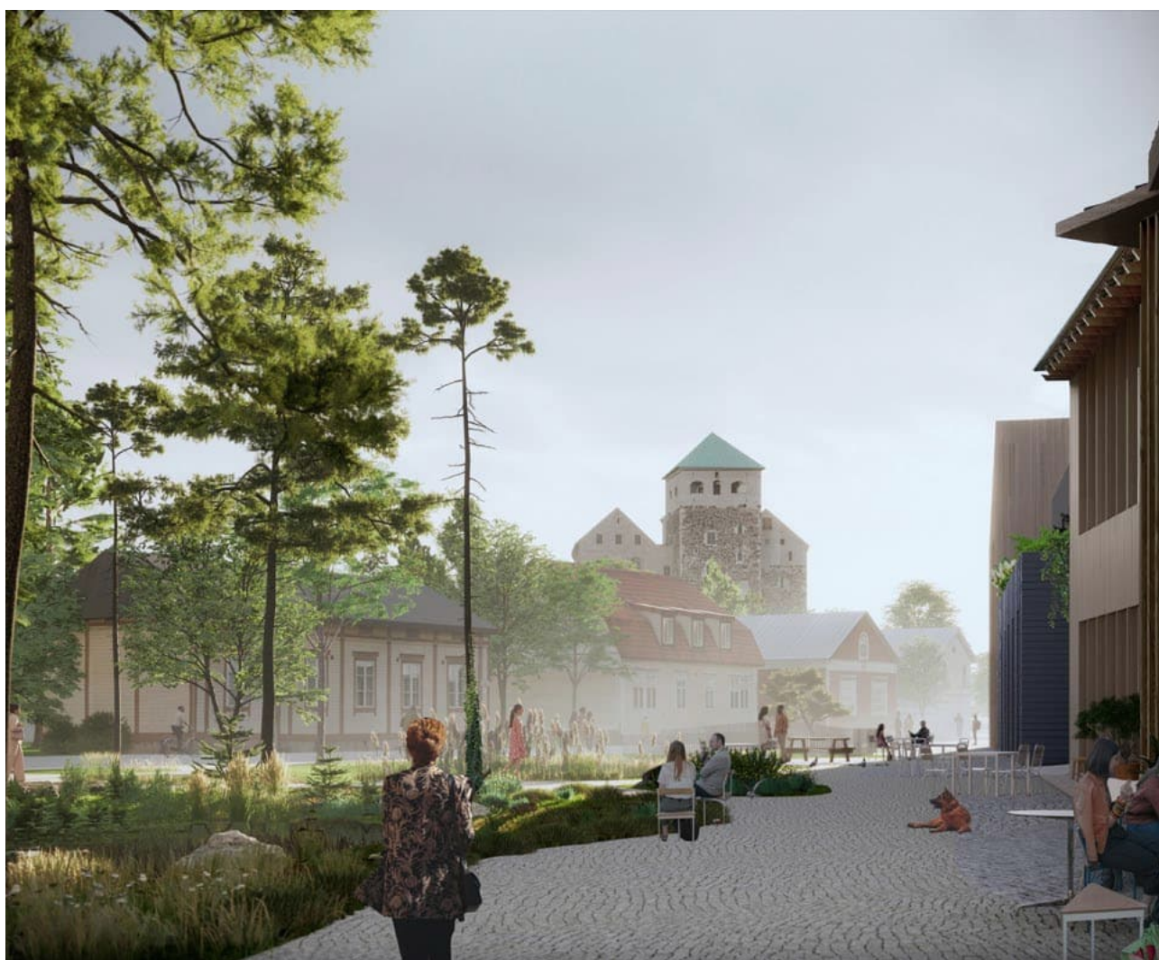
Voittajaehdotus Kolme palaa Linnanniemen ideakilpailussa.