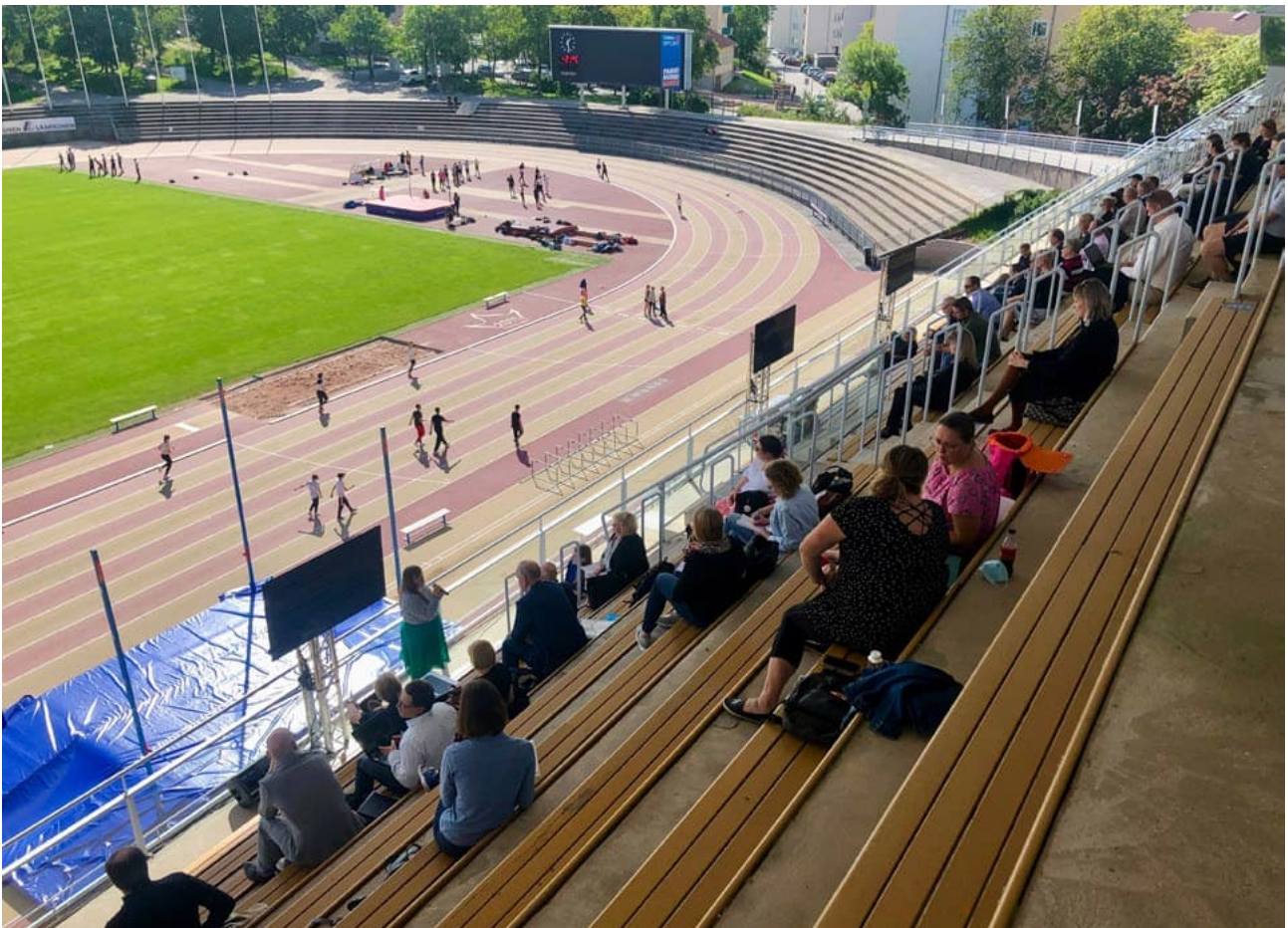
Korona-ajan ulkoseminaari, "Stadionluokan asumistutkimustapahtuma" 2021.

Yliopistot toimivat näissä puitteissa parhaiten kehittämistoimintojen analyttisinä sparraajina, kriittisinä vastavoimina sekä yhteiskunnallisen keskustelun laajentajina ja syventäjinä. 23 Tutkimustiedon soveltaminen edellyttää myös kaupunkiorganisaation omaa perehtymistä ja pohdintaa. Yhteiskehittely on prosessin eri vaiheissa tapahtuvan muodollisen ja epämuodollisen vuorovaikutuksen tulos. Mauser et al. on jakanut prosessin kolmeen osaan: yhteissuunnitteluun (co-design), yhteistoimintaan (co-production) ja yhteiseen tiedon jakamiseen (co-dissemination), joita kaikkia tarvitaan tutkimuksen yhteiskun- nallisen vaikuttavuuden parantamiseksi. 22 Turun kaupunkitutkimusohjelmassa toteutuu osapuolten aktiivinen ja tavoitteellinen osallis- tuminen kaikissa näissä vaiheissa (kuvio 2).