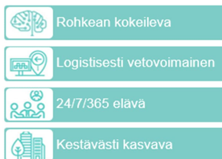
Kuva 1. Tiedepuisto -kärkihankkeen painopistealueet

Tiedepuisto -kärkihanke rakentuu kuvan 1 mukaisista painopistealueista. Tiedepuiston kehittämisen painopistealueet toimivat kärkihankkeen toteuttamisohjelman pohjana.