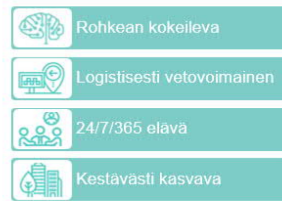
Kuva 1. Tiedepuisto -kärkihankkeen painopistealueet

Kehittämisen painopistealueet luovat pohjan alueen kilpailukyvyyn ja vetovoiman vahvistamiselle paitsi monipuolisen koulutus- ja tutkimuskeskittymänä myös kansainvälisesti merkittävänä osaamisintensiivisen yritystoiminnan keskuksena ja vetovoimaisena asuinympäristönä. Painopisteistä kertova kohderyhmälähtöinen viestintä edesauttaa myös kansainvälisesti kiinnostavan Turun Tiedepuisto (engl. Turku Science Park) -brändin rakentumista.