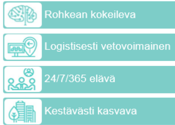
Kuva 1. Tiedepuisto -kärkihankkeen painopistealueet

Kehittämisen painopistealueet luovat pohjan alueen kilpailukyvyyn ja vetovoiman vahvistamiselle paitsi monipuolisen koulutus- ja tutkimuskeskittymänä myös kansainvälisesti merkittävänä osaamisintensiivisen yritystoiminnan keskuksena ja vetovoimaisena asuinympäristönä. Painopisteistä kertova kohderyhmälähtöinen viestintä edesauttaa myös kansainvälisesti kiinnostavan Turun Tiedepuisto (engl. Turku Science Park) -brändin rakentumista.