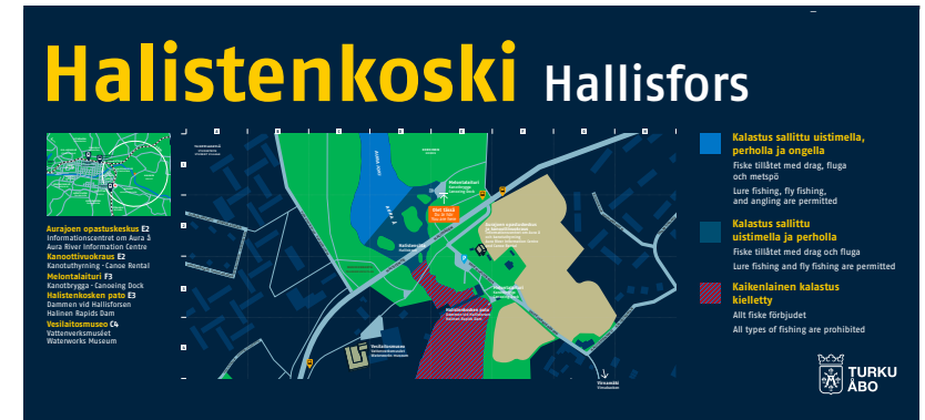
Esimerkki Halistenkoskelle suunnitellusta karttaopasteesta

Alustava kustannusarvio siihen liittyvään auditointiin ja opastamiseen suunnitteluun on yhteensä 4 työviikkoa à 3400 € + alv 24 %.