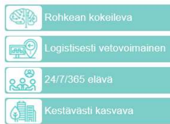
Kuva 1. Tiedepuisto -kärkihankkeen painopistealueet

Tiedepuisto -kärkihanke rakentuu kuvan 1 mukaisista painopistealueista. Tiedepuiston kehittämisen painopistealueet toimivat kärkihankkeen toteuttamishojelman pohjana. Toteuttamishojelma sisältää painopistealuekohtaiset toteuttamissuunnitelmat, tavoitteet ja mittarit.