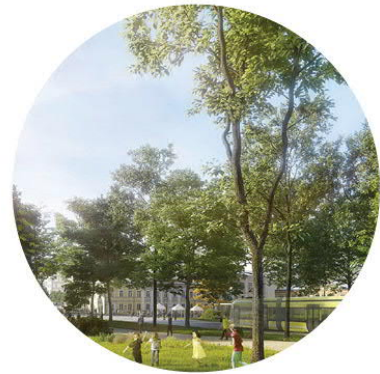
Viihtyisä ja elävä kohtaamisten keskusta