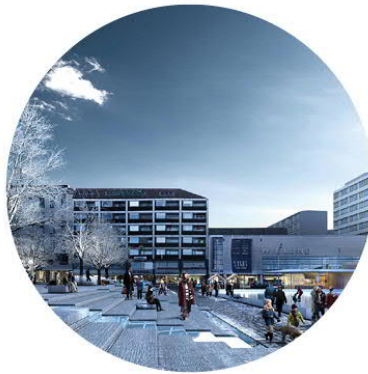
Kaupallisesti houkutteleva keskusta