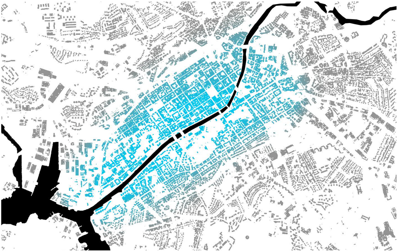
Kilpailun kohdealueena toimii Turun keskusta