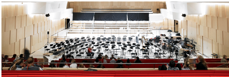
Kampusalue Alsion, Sönderborg, Tanska: Yliopisto, tutkimuspuisto, konserttisali

Hybridihankkeet ovat usein hyvin näkyviä sekä keskeisiä muutoksia kaupunkien tarjonnassa, joihin pyritään saamaan keskenään monin tavoin kommunikoivia toimintoja. Lisäksi niillä pyritään luomaan uudenlaisia toimintaympäristöjä ja tiloja, jotka ideaalisesti koskettavat kaikkia erilaisia sosiaalisia ryhmiä, eivät ainoastaan yhtä.