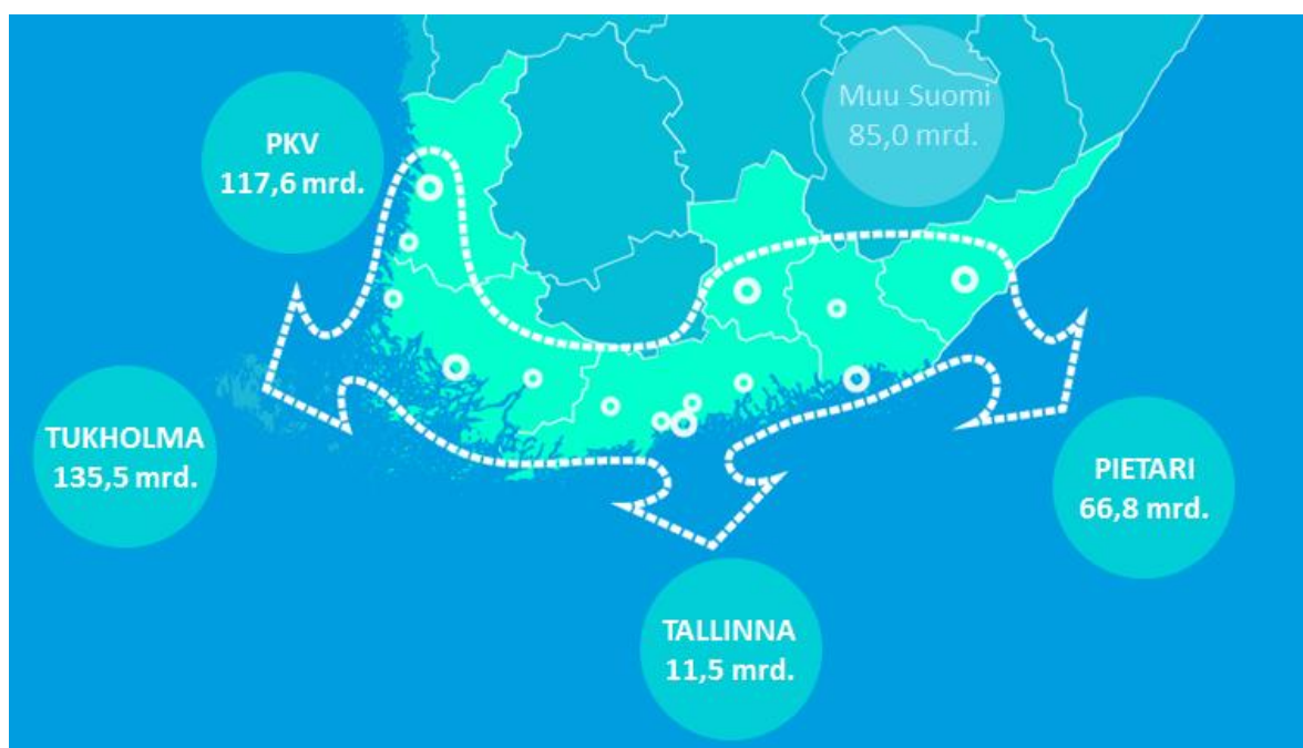
Kuva 1. Pohjoinen kasvuyöhyke yhdistää 330 miljardin euron talousalueen ja 13,1 miljoonaa ihmistä.

Pohjoisen kasvuyöhykkeen alueella muodostuvien vientiteollisuuden kuljetusketjujen ja logistiikkapalveluiden sekä satamien ja koko kuljetusjärjestelmän täysimääräinen hyödyntäminen on koko Suomen talouden kasvun, vientialojen kilpailukyyn ja transitoliikenteen kannalta elintärkeää.