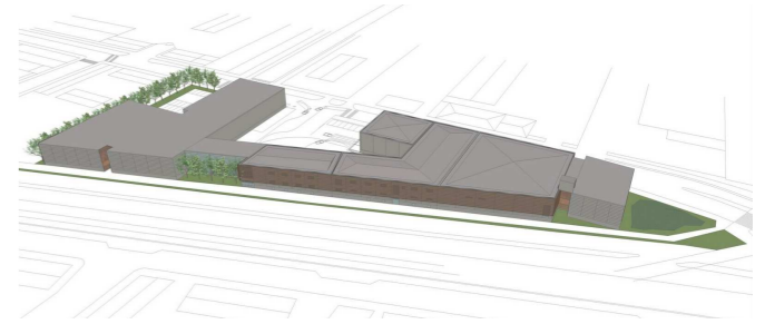
Havainnekuva Arkkitehtitoimisto Sabelström Oy