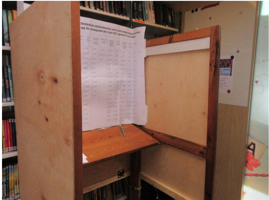
Kuva 10. Äänestyskoppi vaalibussissa

Vaalitoimitsijat kertoivat, että siihen mennessä kaikki halukkaat äänestäjät olivat päässeet bussiin ja tarvittaessa heitä oli autettu. Kertaan ei ollut tarkoitus kääntyä pois, vaan käytävissä oli kirjoitus-alusta, jos äänestämään tullut henkilö ei olisi päässyt sisälle bussiin ja äänestäminen olisi pitänyt suorittaa ulkona. Tätä järjestelyä ei ollut kuitenkaan jouduttu käyttämään.