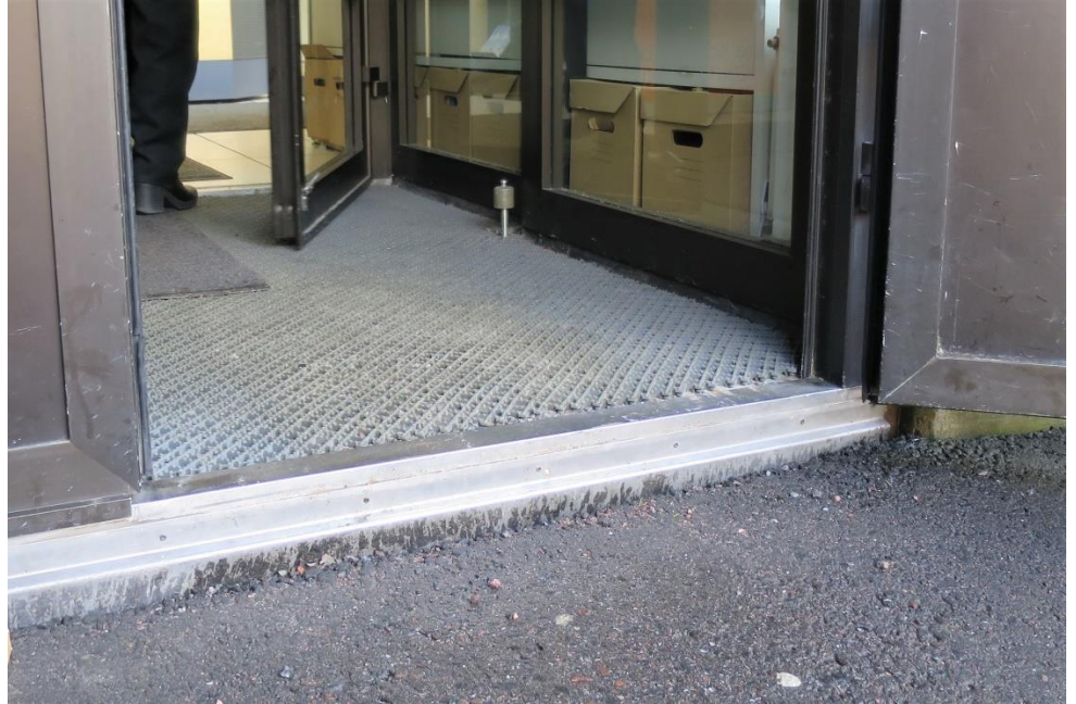
Kuva 3. Ulko-oven kynnys oli korkea

Äänestyspaikkana oli suuri erillinen huone, jossa ei ollut samaan aikaan muuta toimintaa. Huone oli rauhallinen. Äänestyspaikassa oli kaksi äänestyskoppia, joista toinen oli esteetön ja soveltui pyörätuolia ja muita liikkumisen apuvälineitä käyttävälle henkilölle. Esteetöntä äänestyskoppia ei ollut erikseen merkitty. Äänestyskopeissa oli vaaliluettelot. Äänestyskopit oli sijoitettu tilaan selkeästi ja väljästi ja takasivat hyvin vaalisalaisuuden säilymisen. Esteettömässä äänestyskopissa ei ollut lisävalaistusta ja valaistusmittarin mukaan valaistus ei ollut riittävä. Tästä havainnosta kerrottiin vaalitoimitsijoille ja he lupasivat järjestää lisävalon. Äänestystilassa oli tarjolla tuoleja levähdyspaikaksi.