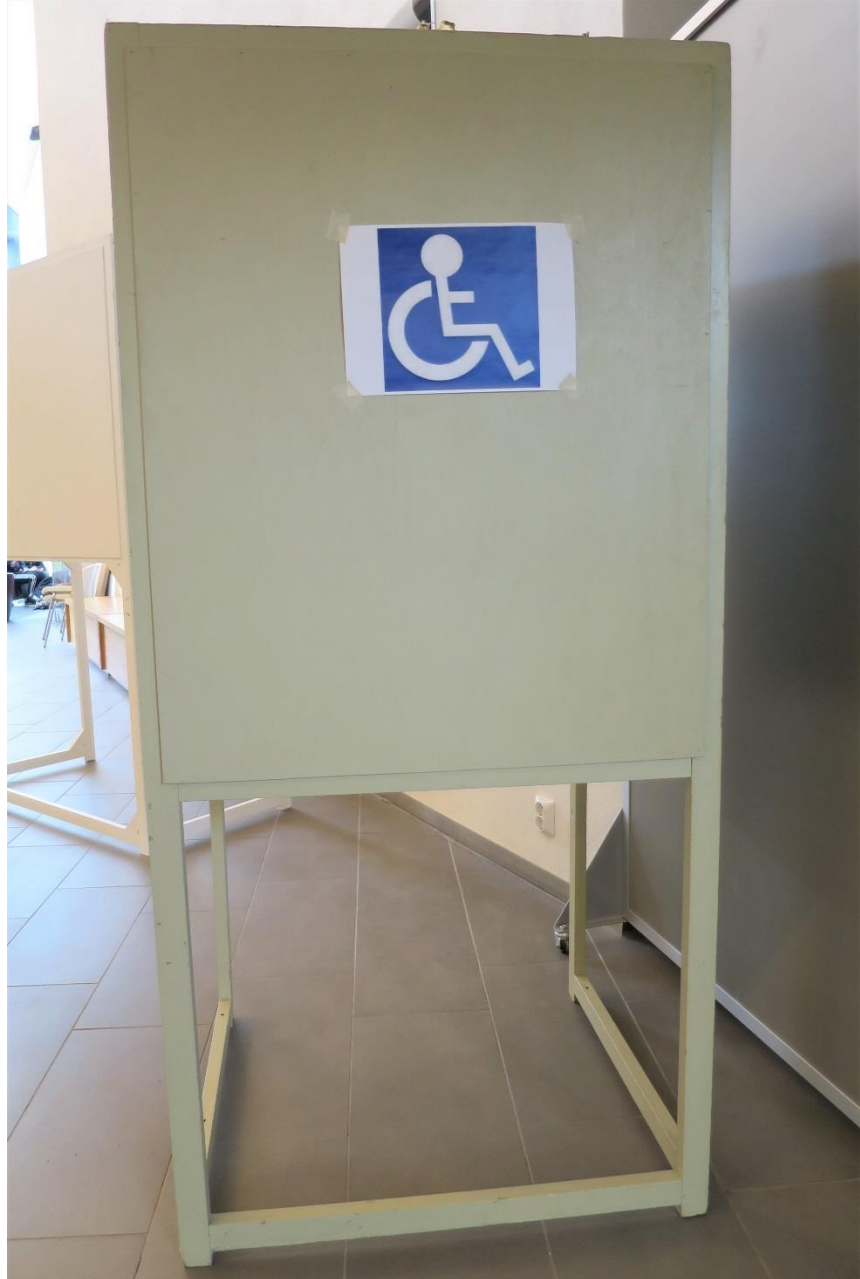
Kuva 7. Esteetön äänestyskoppi oli kapea

Äänestyspaikassa oli 4 äänestyskoppia, joista yksi oli esteetön ja soveltui kapeutensa vuoksi huonosti pyörätuolia ja muita liikkumisen apuvälineitä käyttävälle henkilölle. Esteettömän äänestyskopin leveys oli vain 74 cm. Toiset äänestyskopit olivat varsin leveitä (127 cm), mutta kirjoitustaso oli korkealla (102 cm) esimerkiksi pyörätuolia käyttävälle. Äänestyskopeissa oli vaaliluettelot.