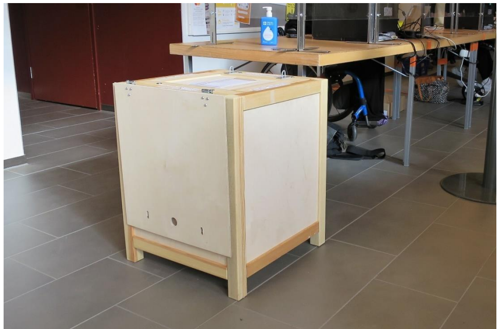
Kuva 8. Vaaliurna

Paimiolaisten henkilöiden valmiit äänestyskuoret tiputettiin vaaliuurna. Muiden kuntien äänestäjien kuoret laskettiin ja laitettiin postin muovilaatikkoon. Muovilaatikat eivät olleet lukittuja eikä niissä ollut kansia. Vaaliurna ja tarvikkeet säilytettiin yön yli lukitussa paikassa.