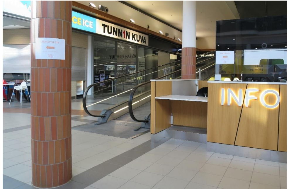
Kuva 1. Opasteäänestyspaikalle infon vieressä

kauppakeskus oli ollut ennakkoäänestyspaikka myös aiemmin, mutta äänestyspaikan sijainti kauppakeskuksen sisällä oli vaihdellut. Äänestäjät olivat kehuneet kauppakeskusta äänestyspaikkana hyväksi ja myös pitkää aukioloaikaa pidettiin hyvänä. Kauppakeskus on esteetön ja siellä on helppo kulkea myös apuvälineitä käyttäen.