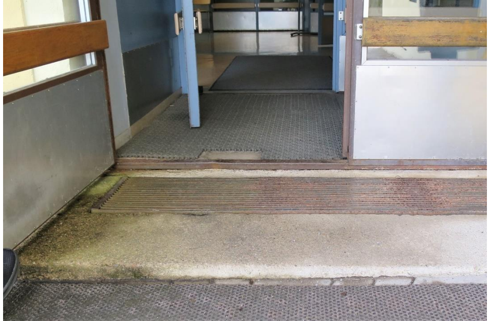
Kuva 6. Sisälle johtaneet kynnykset ja raskas ovi

Äänestyspaikkana oli suuri rauhallinen huone, jossa ei ollut samaan aikaan muuta toimintaa. Äänestystapahtumaa oli rauhoitettu ohjaamalla äänestäjiä poistumaan eri ovesta. Äänestyspaikassa oli 3 äänestyskoppia, joista yksi oli esteetön ja soveltui pyörätuolia ja muita liikkumisen apuvälineitä käyttävälle henkilölle. Äänestyskopeissa oli vaaliluettelot. Äänestyskopit oli sijoitettu huoneeseen väljästi, mutta äänestyskoppien sijoittelu olisi voinut ollut mahdollista tehdä paremmin vaalisalaisuuden säilymisen näkökulmasta. Esteetön äänestyskoppi oli sijoitettu varsin lähellä huoneen oviaukkoa. Keskimmäisen äänestyskopin takaa oli mahdollinen kulkureitti kolmannen äänestyskopin luokse.