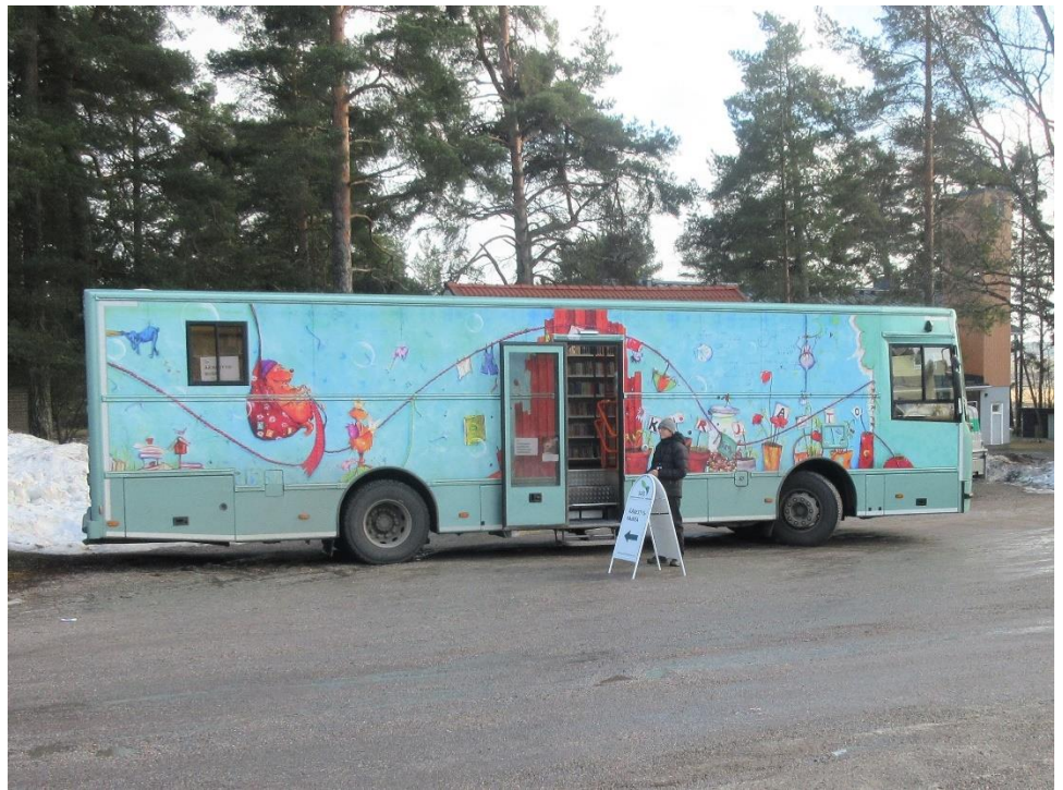
Kuva 9. Vaalibussi

Jo etukäteen oli ilmoitettu, että vaalibussi ei ole esteetön. Bussiin johti jyrkät portaat. Portaiden vieressä oli tukeva kaide, josta oli mahdollista ottaa tukea noustakseen kyytiin.