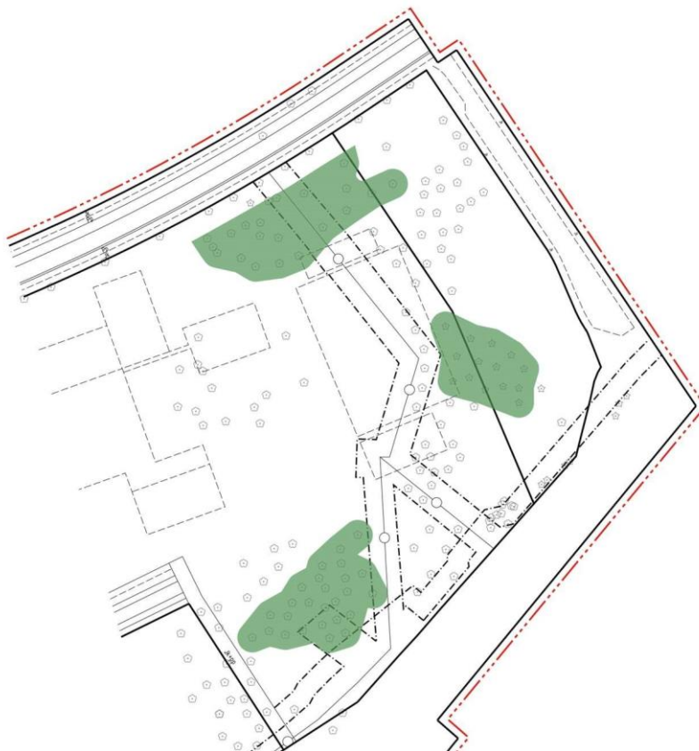
Kuva 3. Hulevesipainanteen suunnittelualue.

Kirstinpuiston hulevesien viivytystä varten on Vaasanpuiston alueelle varattu hulevesipainanteelle suunnittelualue (Kuva 3) jonka sisälle hulevesipainanteen tullaan suunnittelemaan. Hulevesipainanteen alue sijaitsee alustavassa asemakaavaluonnoksessa puistoalueella. Puistoalueen mahdollista käyttöä välituntipihana tulee tarkastella ottaen huomioon hulevesipainanteen tuottamat rajoitteet. Esimerkiksi sateen jälkeen todennäköisesti ruohopintainen painanne ei kestä käyttöä välituntipihana. Mahdollisessa välituntikäytössä tulee myös huomioida lasten turvallisuus.