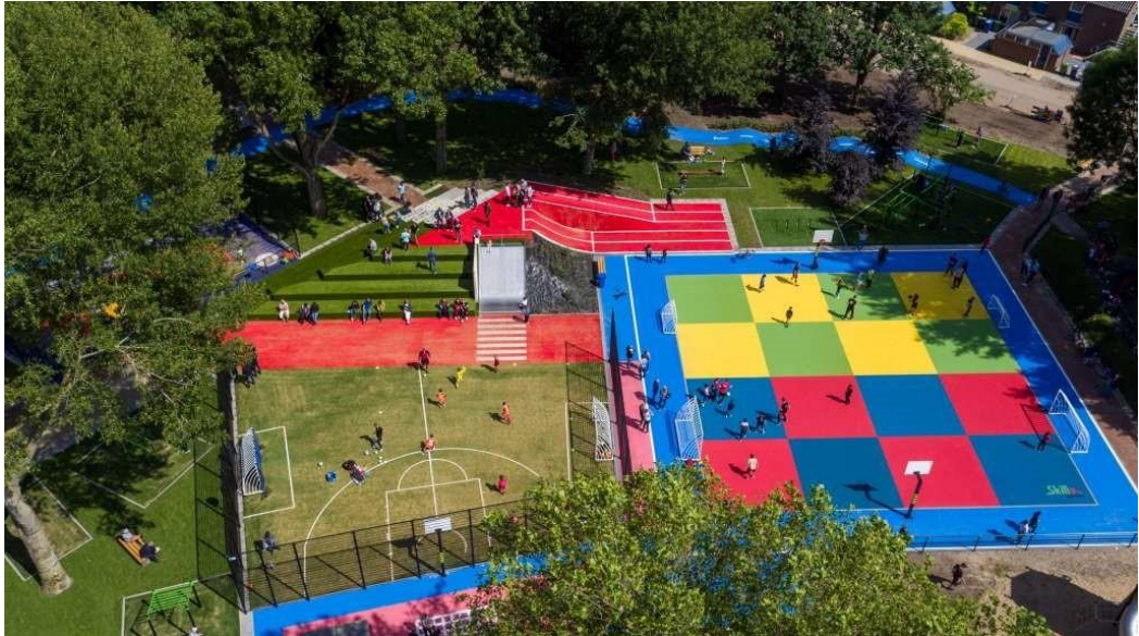
Kuva 1. Esimerkki Skills Garden -konseptista, joka pohjautuu tutkittuun tietoon edistäen motoristen taitojen kehitystä.

Varsinaisten liikuntatilojen lisäksi eri monitoimitalon tiloihin voidaan sijoittaa myös muita liikkumiseen kannustavia elementtejä, esimerkiksi pingispöytiä, kiipeilyseinillä käytettäviä kiipeilyotteita ja muita aktivoivia alueita sekä välineistöä, jotka kannustavat aktiiviseen tekemiseen ja liikkumiseen.