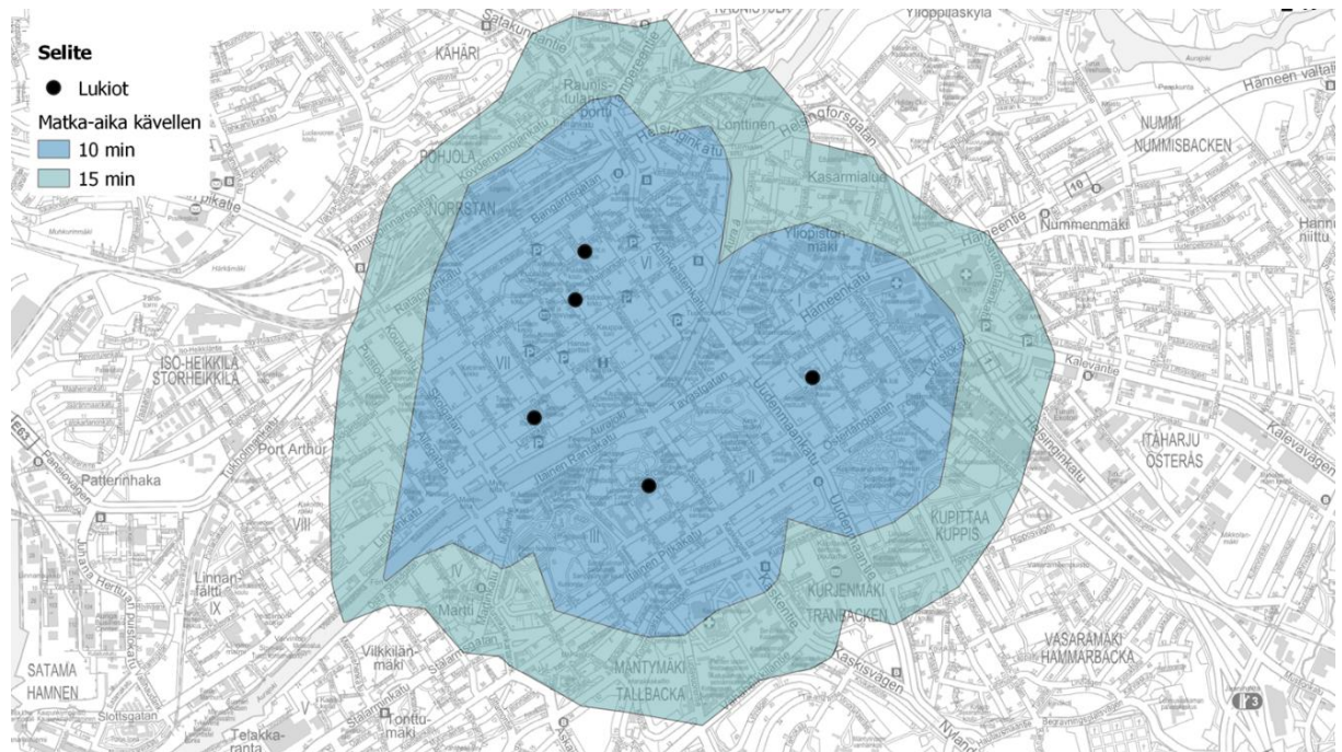
Kuva 2 Lukioiden saavutettavuus kävelen

Tarveselvitysvaiheessa ei ole ehdottomasti määritelty, mihin olemassa olevaan lukioon lisäpaikat tulisi liittää. Aihetta voidaan lähestyä eri näkökulmista, mm: