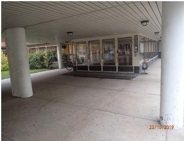
Pääsisäänkäyntien ulko-ovet ovat alkuperäiset.