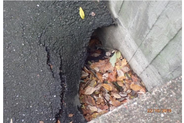
Rakennuksen itäpuolella on veden aiheuttamaa maan eroosiota.