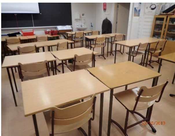
Luokkahuoneet ovat tyydyttävässä kunnossa.