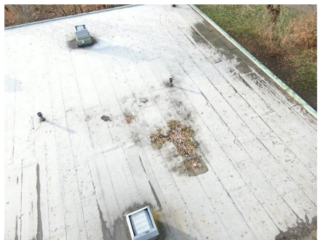
Puiden lehtiä on kattokaivojen ympärillä.