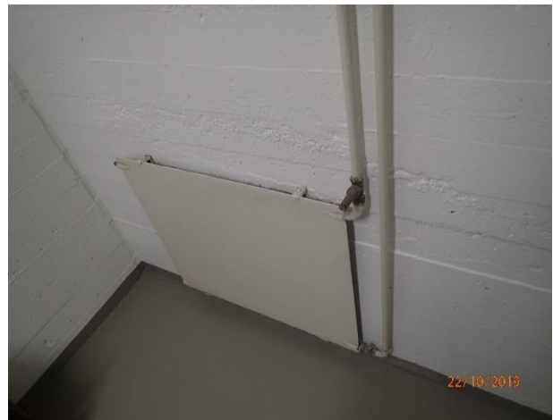
Rakennuksen patterit ovat pääasiassa vanhoja.