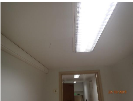
Tilojen valaistus on riittävä.