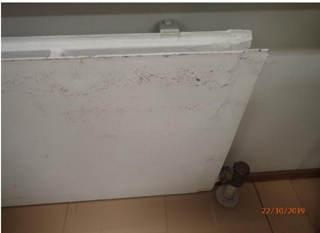
Lämmityspatterit ovat välttävässä kunnossa.