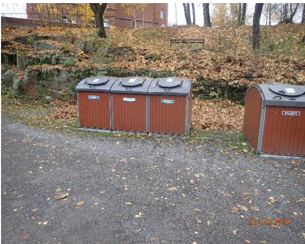
Jäteastiat ovat tyydyttävässä kunnossa.