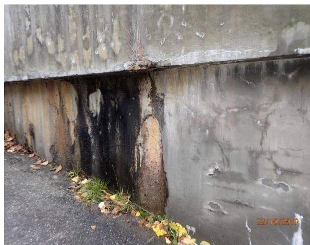
Pihakannen perustus on huonossa kunnossa.