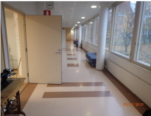
Käytävät ovat tyydyttävässä kunnossa.