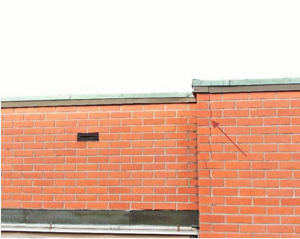
Tiilijulkisivussa on halkeama.