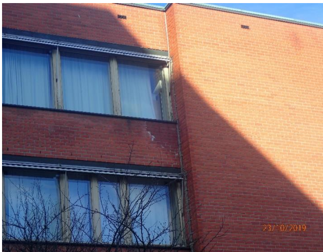
Luostarinkadun puoleinen kosteusjälki.