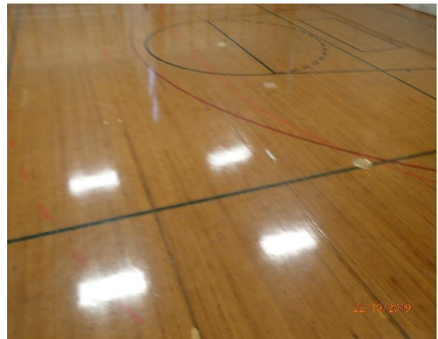
Liikuntasali on tyydyttävässä kunnossa.