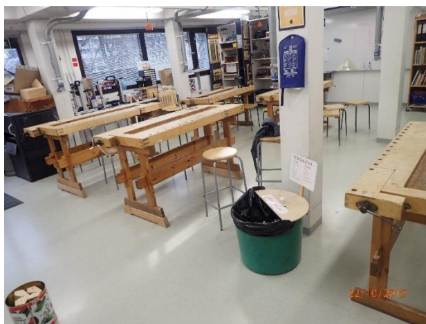
Puutyöluokka on tyydyttävässä kunnossa.