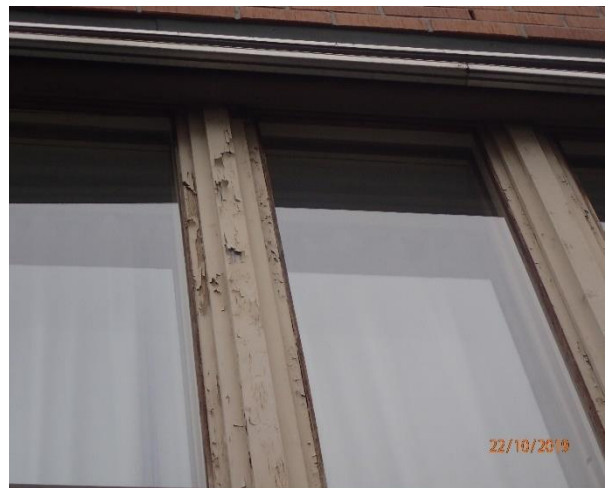
Ikkunoiden ulkoiset puuosat ovat heikossa kunnossa.