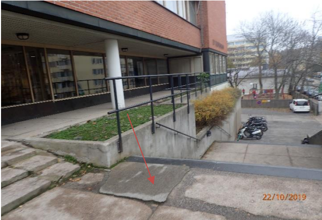
Portaiden yläosassa kompastumisvaara.