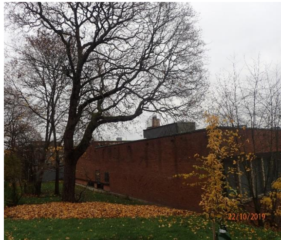
Rakennuksen pohjoispuolella puun lehtiä tippuu katolle.