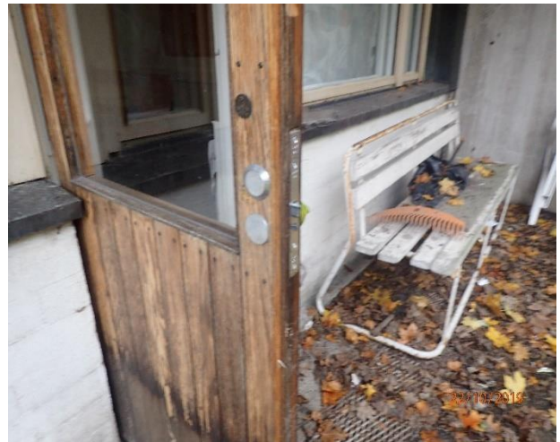
Vähemmällä käytöllä olevat ovet, ovat puurakenteisia.