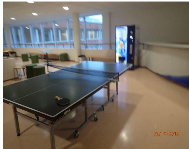
Aulatilat ovat tyydyttävässä kunnossa.