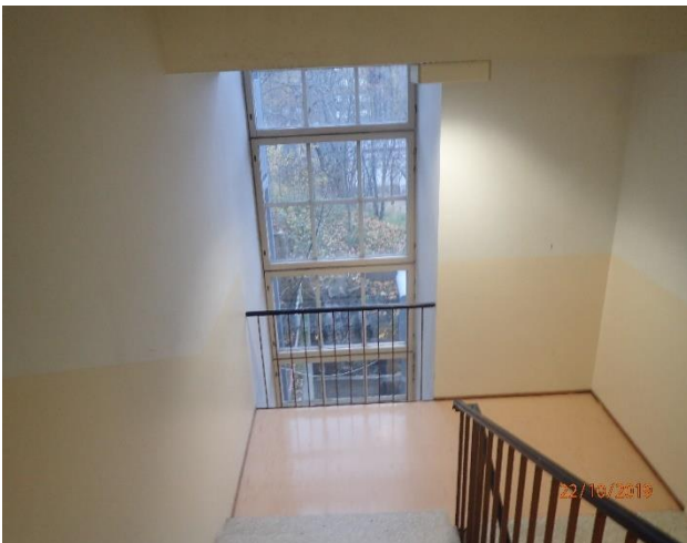
Portaikot ovat tyydyttävässä kunnossa.