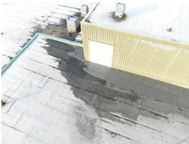
Vesikatolla saattaa esiintyä lämpövuotoa.