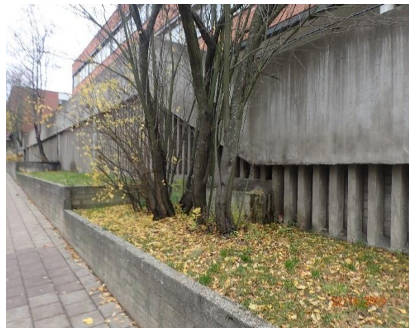
Edustan pengerrys on tyydyttävän kuntoinen.