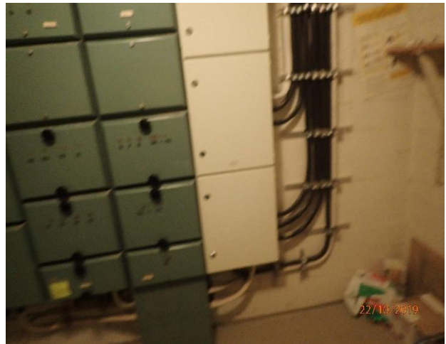
Sähköpääkeskus osin vanhaa.