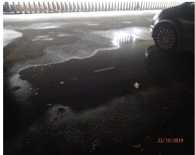
Autohalliin vuotaa vettä paljon.