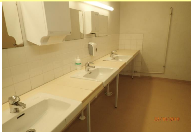
Saniteettitilat ovat tyydyttävässä kunnossa.