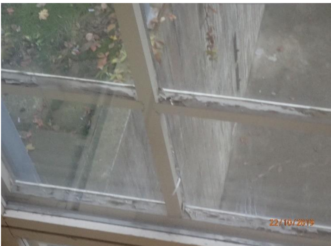
Ikkunat ovat heikossa kunnossa.

Ikkunat ovat heikkokuntoisia. Ikkunoissa hilseilee maali erittäin paljon. Ikkunat suositellaan vaihdettavaksi 5. vuoden kuluessa. Ikkunat ovat arviolta alkuperäisiä.