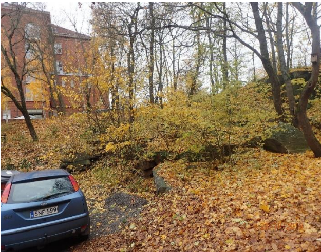
Viheralueet ovat tyydyttävässä kunnossa.