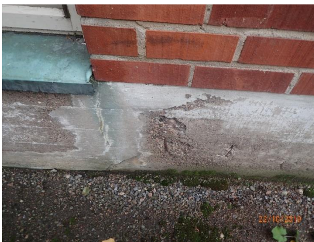
Sokkeli on osin rapautunutta ja teräksiä on esillä.