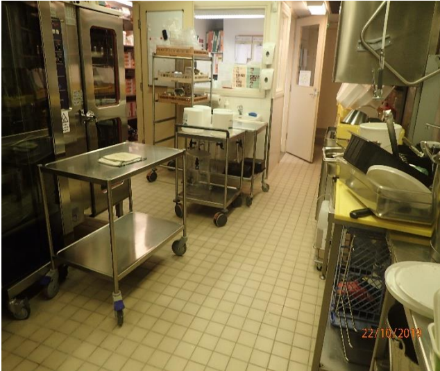
Keittiö on tyydyttävässä kunnossa.