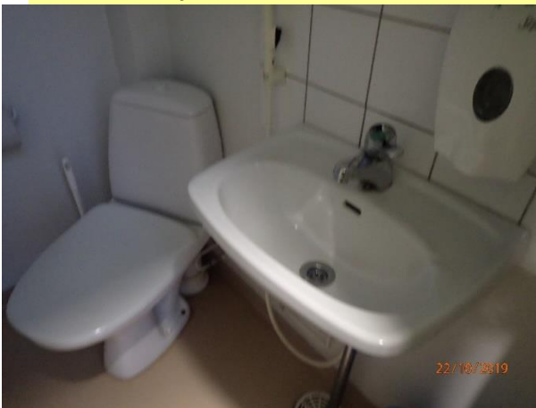
Saniteettitilat ovat tyydyttävässä kunnossa.