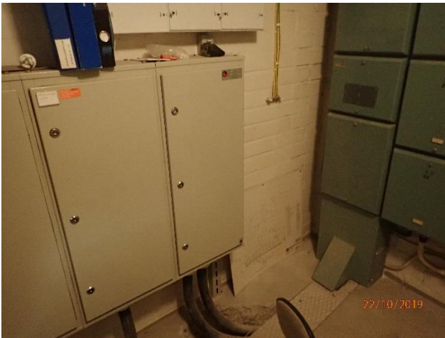
Sähköpääkeskus on osin uudistettu.