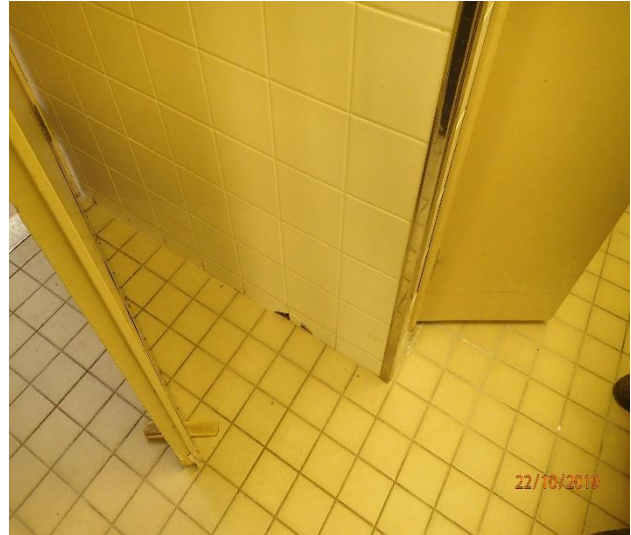
Seinän alaosassa on reikä.