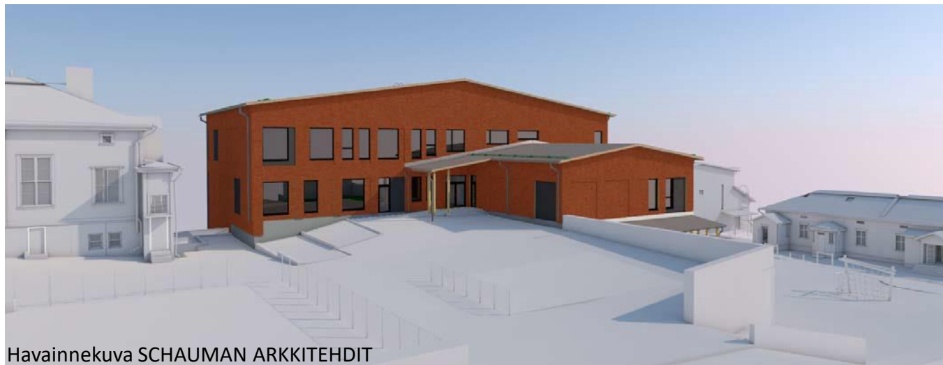
Havainnekuva SCHAUMAN ARKKITEHDIT