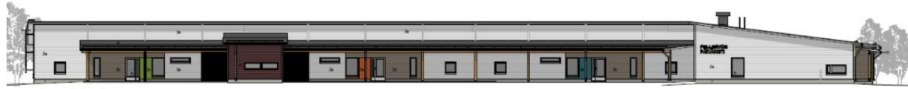
JALKIKSIA KOLLEEN (LEIKKIPALLO)